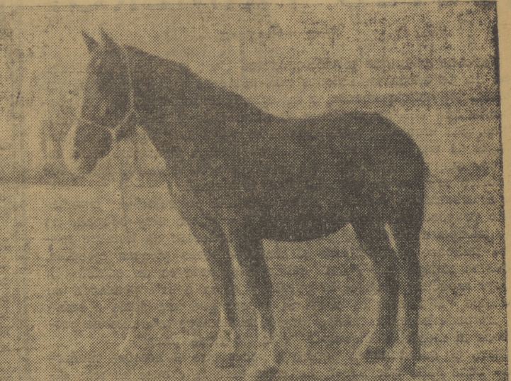
Magnífico ejemplar de caballo percheron, muy utilizado en terreno llano, sobre todo para el arrastre de forrajes. Es muy utilizado en Polonia y algunos países bálticos. También se utiliza en algunas regiones españolas