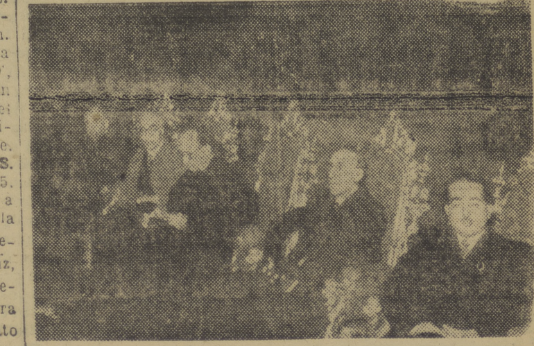
El subsecretario de Educación Nacional, con otras personalidades, preside la solemne función religiosa celebrada en la iglesia de San Francisco el Grande, con que comenzó la Asamblea.