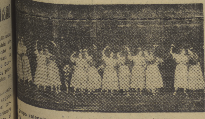
Competition national de danses folkloriques espagnoles. La competición nacional de danzas folclóricas celebrada en Madrid, durante los días, con asistencia de la Excm.ª señora doña Carmen Polo de Franco y otras personalidades.