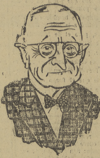
Mr. Harry S. Truman