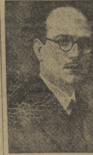
Sr. Ibáñez Martín