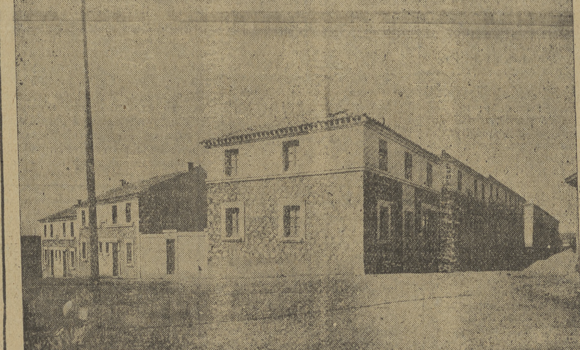
En Roa de Duero también ha florecido la obra espléndida y generosa de nuestro Estado, que a través del jefe provincial del Movimiento, ha sido una realidad, de la que es elocuente muestra la presente fotografía.