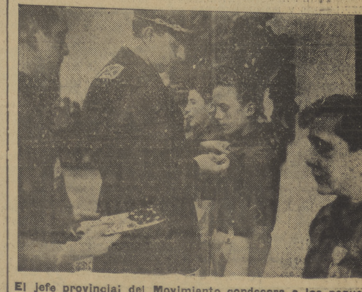
El jefe provincial del Movimiento concede a los pequeños camaradas distinguidos en diversos servicios o por su constancia en las tareas del Frente de Juventudes.