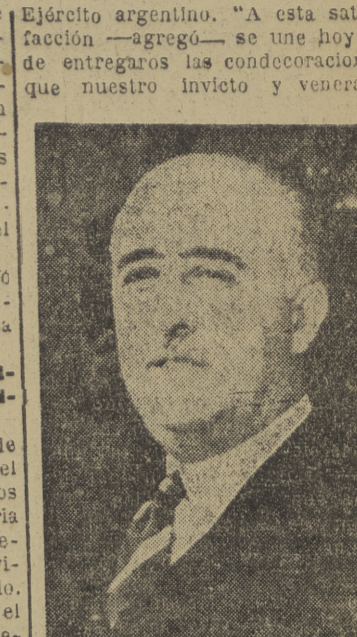
Caudillo os ha concedido. Y en este acto de imposición y entrega os ruego que veáis el profundo y entrañable sentimiento de los españoles al tenernos con vosotros".

El ministro del Ejército pronunció unas palabras en las que dijo que este viaje de la misión extraordinaria argentina no había deparado el placer de tener entre nosotros a destacados generales en los que se encarnan las virtudes del