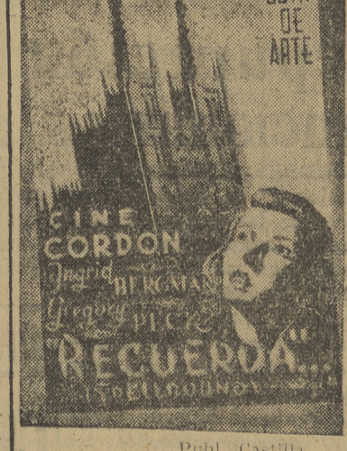
ESTRENO EN BURGOS: 10 octubre - 1946 RECUERDA... (SPELLBOUND) Estrenada el primero de noviembre de 1945 en el Astor de New York, ha sido considerada como la joya máxima del séptimo Arte.

La más sorprendente creación de la cinematografía