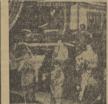
La orquesta GEA y sus trovadores, que actúan en el Salón de Fiestas del Gran Teatro.