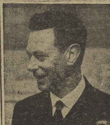
Jorge VI de Inglaterra

24. — Hoy ha sido inaugurada oficialmente en este museo la exposición titulada "Los productos de la industria británica". El rey Jorge VI asistió a la inauguración en el Museo Victoria y Albert, acompañado por el primer ministro, Attlee. El rey pronunció un discurso en el que se acordó que se exhibieran los productos de la industria británica que se organizan en la más grave crisis de nuestra historia, se celebran en el Museo de Victoria y Albert, que contiene algunos de los más hermosos productos de la industria británica. Uno de los principales objetivos fue el perfeccionamiento de los productos. Desde entonces, se han expuesto en la industria de la fuerza, han formado la misma causa.