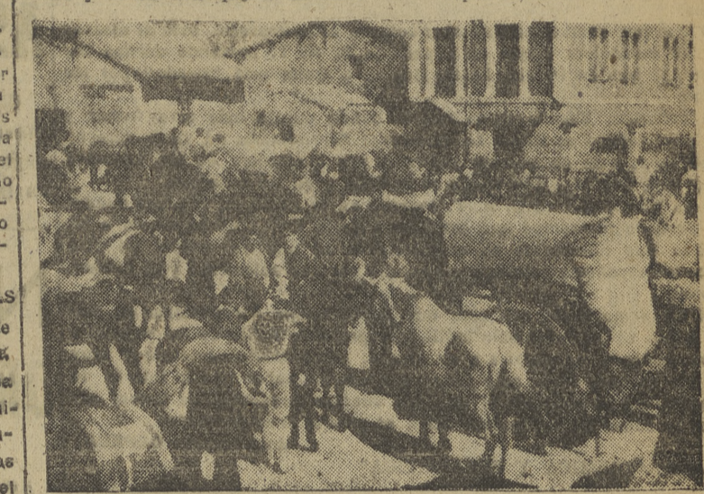
Una vista del ferrial, que estuvo muy concurrido. (Foto MURO).

fué ejecutada, y en la mañana del día 22 se hizo público el fallo del jurado calificador y se procedió al reparto de premios. De Burgos se desplazaron un número de ganados que figuraban en el programa, sino que ante la magnífica calidad de muchos ejemplares, fué preciso ampliar considerablemente el número de premios. Por último y con objeto de compensar a todos los ganaderos de los gastos de desplazamiento que realizaron, se dieron premios de concurrencia a todos, sin excepción, que acudieron al certamen.