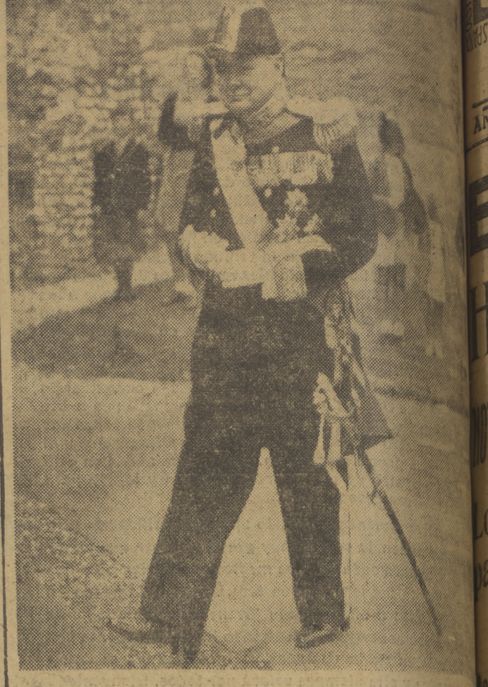
Winston Churchill, que apagó serenamente el incendio del Imperio como si apagara la colilla de su puro, afronta tranquilamente ahora su gloria de Almirante Guardiano...