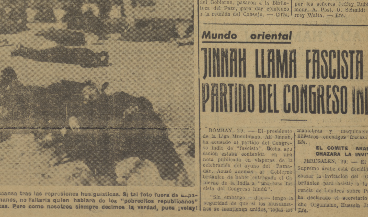
La Policía surafricana descansa tras las represiones hueguísticas. Si tal foto fuera de España y cayera en "ciertas" manos, no faltaría quien hablara de los "pobrecitos republicanos" asesinados por los fascistas. Pero como nosotros siempre decimos la verdad, pues ¡vaya!