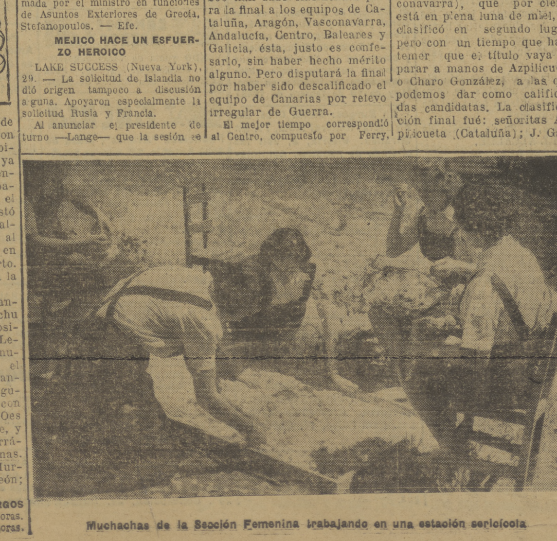
Muchachos de la Sección Femenina trabajando en una estación seriológica.

El tiempo... MADRID, 29. — En el día de ayer en el Norte se produjeron chubascos, casi siempre débiles... BURGOS. Mínima, 11'2, a las 6'30 horas. Máxima, 19'4, a las 17 horas.