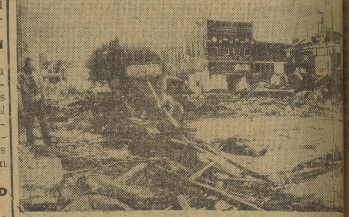
La calle principal de Wells (Minnesota), después del incendio que azotó recientemente la región