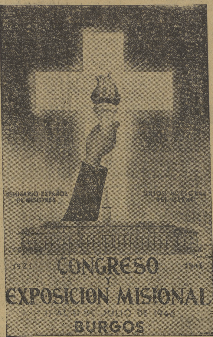
He aquí el cartel anunciador del Congreso Misional, que se celebrará en Burgos.

En España, tras aquel alba lívida, comienza a amanecer. Por el Sur, el aire caliente de palmeras y rocas, arrastra galopadas y canónicas al correr la pólvora. En Castilla se engrasan los fusiles para lanzarse a ganar el Alto de los Leones. Un segundo más, y comenzará a temblar la tierra. Los dados de hierro de la Historia ruedan ya por el aire.