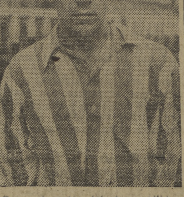
Zarra el centro delantero rojiblanco, presunto arlete internacional contra Irlanda