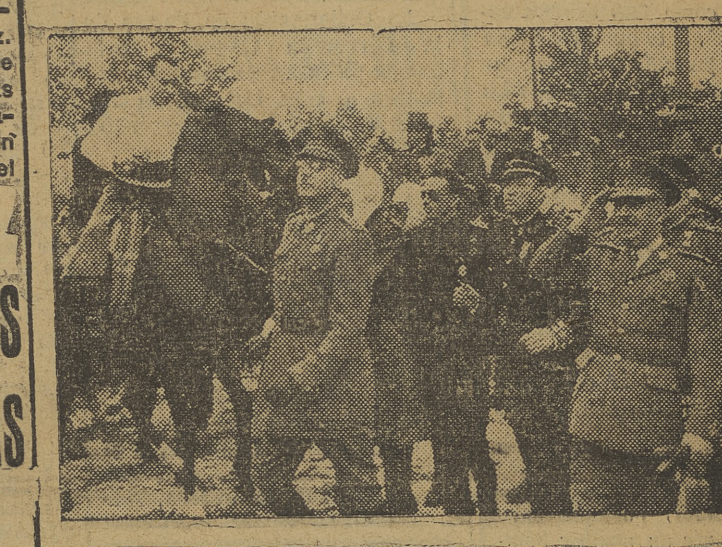
Su Excelencia el Jefe del Estado recorre a pie las calles de un pueblecito andaluz durante el reciente y triunfal viaje del Caudillo por el Sur de España. A los gritos de “Franco, sí, comunismo, no”, el Generalísimo fué rodeado por el pueblo que le vitoreó sin cesar.