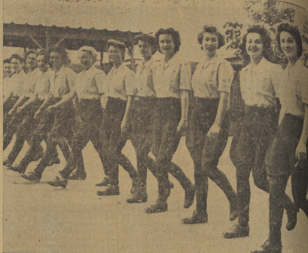
He aquí hecho pimpante primavera el viejo mito de las Amazonas. Ellas también han vivido el ímpetu de la batalla galopando ligeras corceles de neumáticos, y ahora, en el verde césped de Pets Corner, su fina mano está dispuesta para la doma. Son las Amazonas del zoo de Llanowest, pero en sus labios no hay rotundas melodías de Goldmark, sino la dulce canción que anoche escucharon a Sinatra. Y, sin embargo, hace temblar su apatitit si se piensa en ese duro combate que se llama matrimonio.