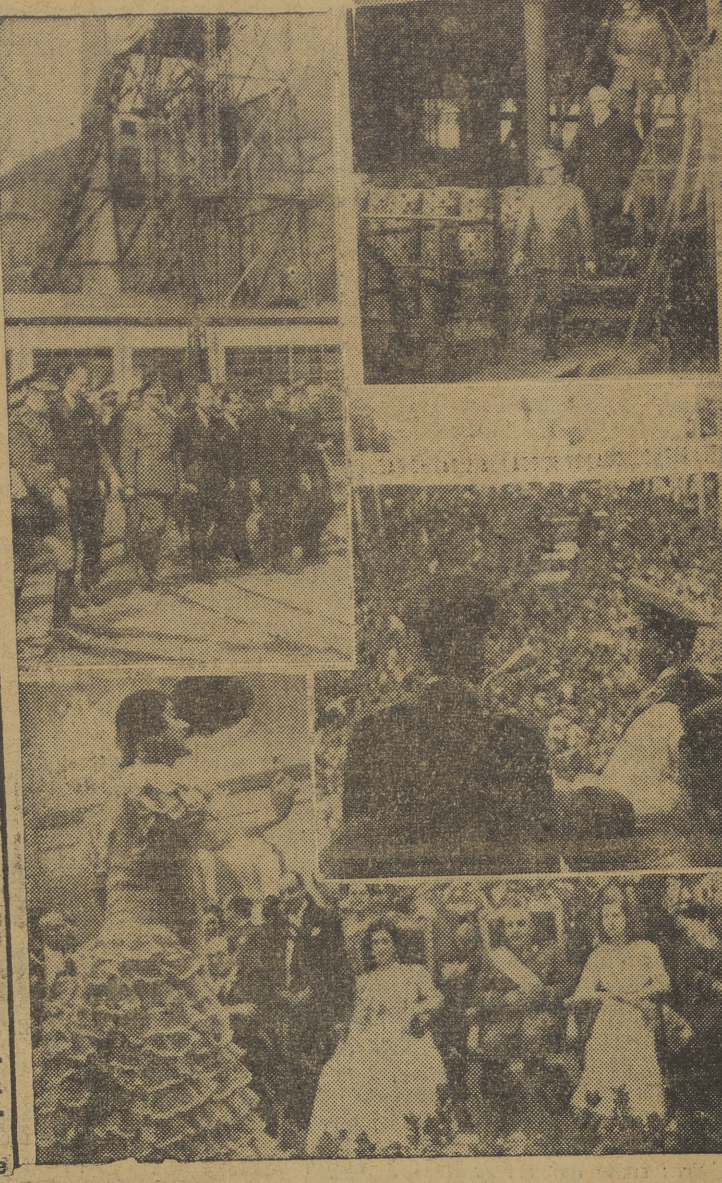
Franco visita la cuenca minera asturiana. — El Caudillo, aclamado fervorosamente por la multitud en Cádiz. — S. E. el Generalísimo asiste a una típica fiesta andaluza en Sevilla, acompañado de su esposa