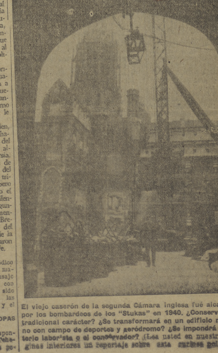
El viejo caserón de la segunda Cámara inglesa fué alcanzado por los bombardeos de los "Stukas" en 1940. ¿Conservará su tradicional carácter? ¿Se transformará en un edificio moderno con campo de deportes y aeródromo? ¿Se impondrá el orden laboralista o el comunal? (Lea usted en nuestras páginas interiores un reportaje sobre esta curiosa polémica)