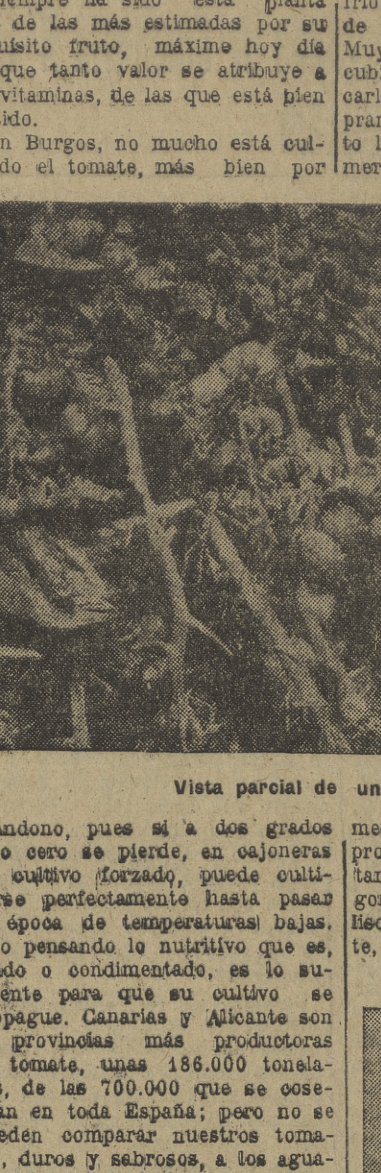
Vista parcial de una tomatera.

"CERES". - El vino tinto se cotiza de 15 a 16,75 pesetas grado y "teófilo" el manchego; de 14 a 16, los de Aragón; de 14,75 a 15,75, los de Navarra; de 15,25 a 15,75, los de Rioja; de 14,75, los del Priorato (Cataluña); y a 15, los de Alicante.