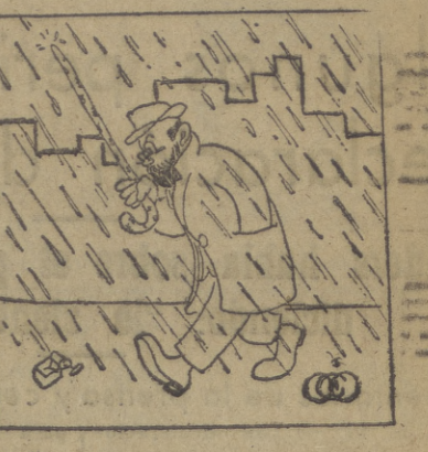
—Estos parangos de ahora, son malísimos...