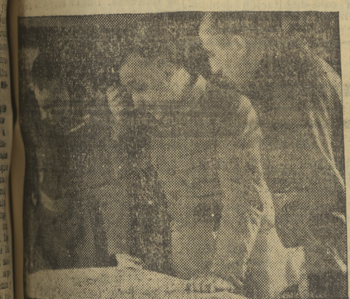
El Caudillo de la guerra y la paz, el hombre a quien ha sido confiada la dirección de España en las dos coyunturas históricas más difíciles y trascendentales de nuestro siglo. Por eso, una anécdota guerrera en sus labios, es una profunda lección de política y de vida española.

MADRID, 7.—Bajo la presidencia del jefe del Estado y del generalísimo de los Ejércitos se ha celebrado esta mañana la inauguración de cinco nuevas salas en el Museo del Ejército.