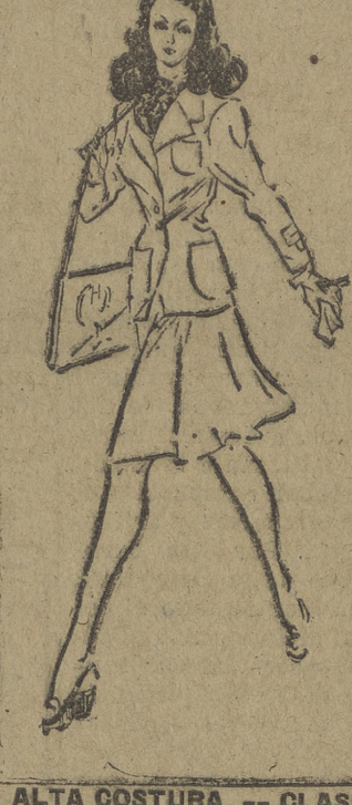
ALTA COSTURA. — CLASES DE CORTE Y CONFECCION PALOMA, 1 y 3, 2. — T. 2475

Es el hecho sencillo de que hombres y mujeres son atraídos al matrimonio por las características desconocidas de los respectivos caracteres, inclinaciones, hábitos, etc., el responsable verdadero de las rencillas en los hogares, de las tragicomedias domésticas que hacen reír a todos menos a sus protagonistas. La atracción de lo opuesto hace que hombres prácticos, dominados por el complejo de los negocios, económicos, sobrios, se unan a mujerescasualidades con una sola idea en sus cabezas bien peinadas: divertirse. Hace que muchas trabajadoras, voluntariosas, buenas, rechazan a quien podría ser para ellas un espeso modelo para aceptar.