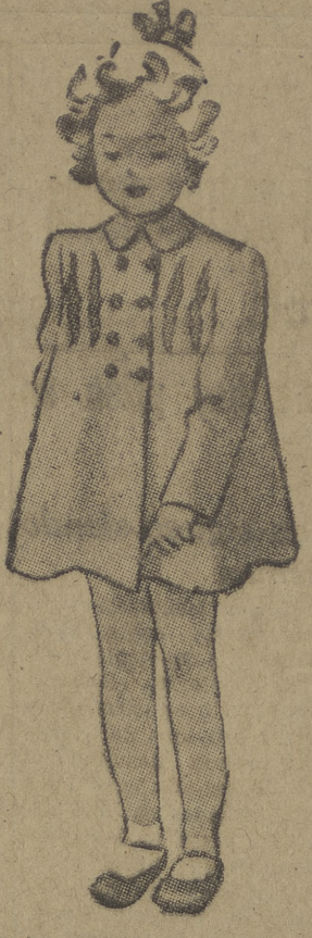
Abriguito de niña de color rojo. En los hombros tiene unas aletas unidas al abrigo por unos pespunte, y hacen juego los bolsos, de la misma forma.

rios. Como puedes comprender, tenía la corazonada y no iba a jugar un miserable décimo. No me interesaba. Emilio se lleva maquinalmente la mano al bolsillo de su chaqueta. El fajo de billetes está allí. Abre la boca para hablar... Pero se calla. Es inútil decir la verdad. Adela estaría en arcajadas entre divertidas y desdénosas. —¡Ah! Fortuna, Fortuna. ¡Qué mala jugada me has hecho! —Y tú, pobre Emilio, ¿has tenido algo de suerte? —Ya, yo...—traga saliva pensativamente. No. No me ha tocado nada. Ya sabes que siempre he sido un gafe. Y. D. La mejor propaganda. Consulte nuestra clientela. RESTAURANTE AUTO-ESTACIONES