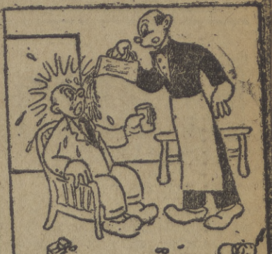
¡Imbécil!! Era en este vaso donde le dije que me echara el agua...!!!