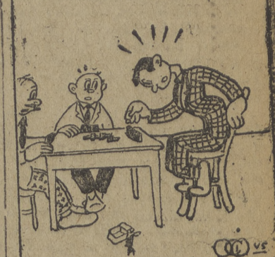
¡Estoy perdido!! ¿Cango que doblarme otra vez...!!