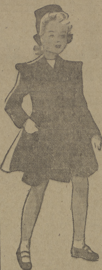
Abrigo de niña, de color rojo. En los hombros tiene unas aletas unidas al brazo por unos pespuntos, y hacen juego los bolsos, de la misma forma.

Especialidad en ABRIGOS DE PIELES confeccionados a medida por Enrique Molina con pieles seleccionadas CAMPO Queipo de Llano, 1 BURGOS