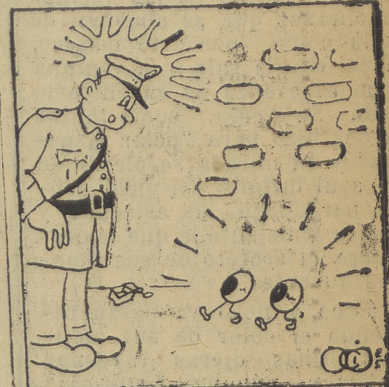
—No se asuste señor guardia Somos los ojos de aquel señor que nos vamos tras ese pastel que ha pasado...