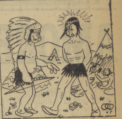
—¿Ya te levantas de jugar? —No, vos que me han "desplumado"...