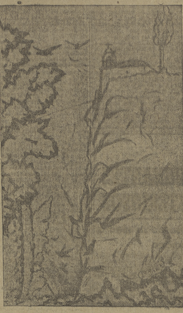
Ermita sobre una de las peñas grajeras de la huerta de los PP. Carmelitas de Segovia, sobre la Fuente, donde gustaba remontarse en su soledad el autor de "Cántico Espiritual". (Dibujo de Er. Marcial, C. D.)

No hay oír su Cántico Espiritual sin que la delicadeza más santa inunde todo nuestro ser; no hay caminar en la Noche Oscura sin saberse transportado por caminos de suavidad hacia lugares no imaginados de dulzura inefable. Si cabe distinguir entre los poetas santos, San Juan de la Cruz es el más delirado de todos. En sus glosas y cánticos contemplados la delicadeza del alma que en Dios se mira como en espejo límpido de la máxima nitidez y transparencia. Cuenta la leyenda que viendo Narciso su imagen reflejada en las aguas de una fuente cristalina, extasiado ante su