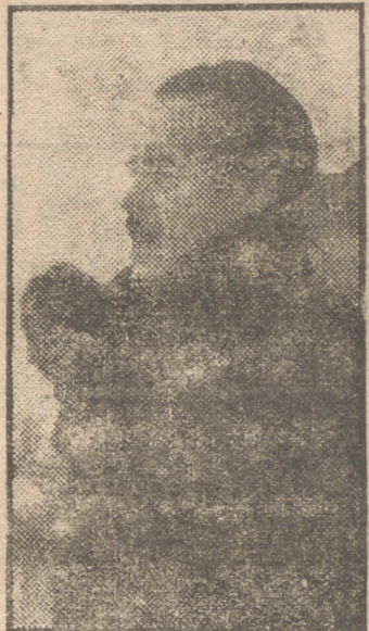
El Delegado Nacional de Ex Combatientes, José Antonio Girón de Velasco, que fue capitán de Infantería durante la guerra de Liberación, pronunciando, bajo la lluvia, su vibrante discurso

Combatientes han sido los hombres que restablecieron la