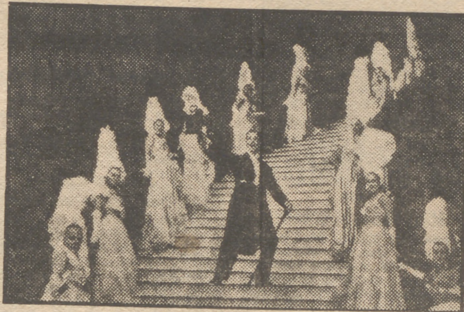
Reproducimos un primer plano del extraordinario film en technicolor «Un americano en París»...

La fantasía ha roto sus límites para crear este jubiloso derroche de arte y belleza