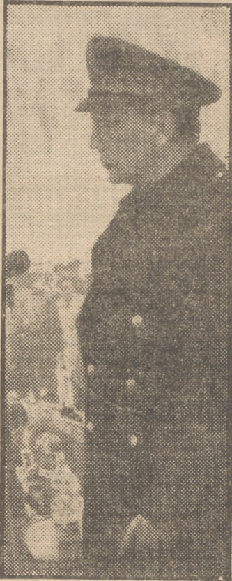
Raimundo Fernández-Cuesta ofreciendo al Caudillo la significación y alcance de la gran concentración de ex combatientes en el Alto de los Leones

Nuestro Movimiento, pues, ni es reacción, ni contrarrevolución, ni dictadura transitoria que busca vencer los obstáculos y resistencias que se oponen a una tarea de restauración, sino un régimen nuevo, instaurado por la Revolución nacional en Julio de 1936 con una doctrina política, social y filosófica que en lo fundamental sigue siendo hoy tan válida como cuando se formulara, pero, en lo contingente y circunstancial, perfectamente adaptable a la realidad de cada momento, por lo mismo que más que un programa concreto—y ésta fue su originalidad—era una manera de entender la vida y de reaccionar ante los problemas que ésta presenta,