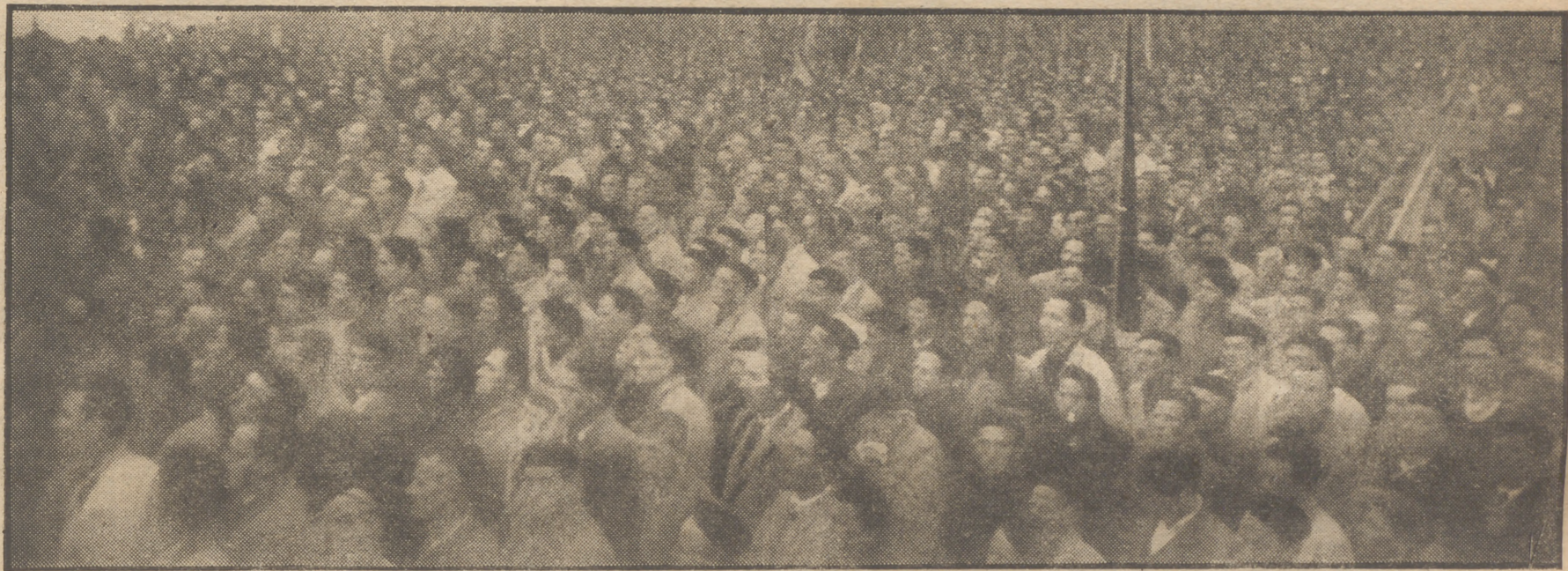
Este impresionante aspecto ofrecía ayer en el Alto de los Leones la gran concentración de ex combatientes de ambas Castillas

Después del discurso de Girón se celebró una misa de campaña. El altar estaba sobre un promontorio y al pie de una cruz gigantesca, monolítica, apenas silueteada en la niebla. Dijo la Santa Misa un ex