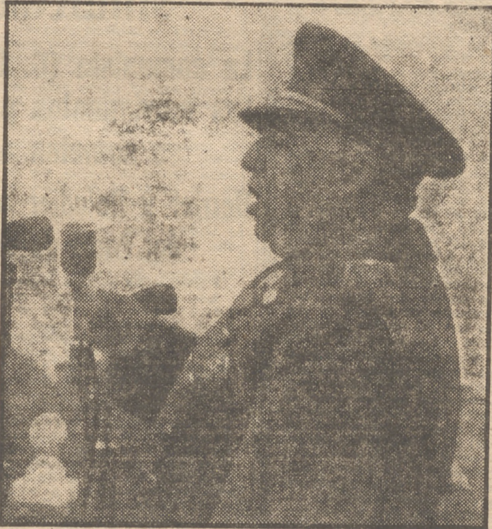
El Generalísimo, primer ex combatiente de España, pronunciando su alocución ante los 50.000 hombres que hace dieciséis años lucharon a sus órdenes

Cuando al mando de nuestros ejércitos rescatábamos en dueña lucha y paso a paso toda la geografía española, con sus valles y montañas, sentía todo el dolor de la sangre generosa que derramabais y presentía que Dios, en sus inescrutables designios, quería unirnos más estrechamente por el heroico sacrificio de nuestros mejores. Mártires y héroes que más de una vez, en estos años difíciles de la posguerra, presentíanos hacían la guardia de su Patria en peligro. Mas si en el cielo ellos forman legión para velar nuestra victoria, aquí, en la tierra, corresponde a vosotros, combatientes de nuestra Cruzada, el velar porque no se pierda, como tantas veces la perdimos a través de la Historia y recientemente la hemos visto perder en los campos de Europa. Es necesario que esa insobornable lealtad frente a la crítica desmoriladora, que esa forma noble y generosa con que supisteis vencer los años de escasez y necesidad, que esa moral de victoria y esa fe en la revolución nacional creadora se transmitan íntegras sobre las generaciones que nos sigan si no queremos que nuestro esfuerzo se pierda en la dimensión del tiempo, como se perdieron hasta casi extinguirse los esfuerzos de aquella otra generación de nuestros siglos de oro. Pueblo el español de heroicas virtudes, somos pro-