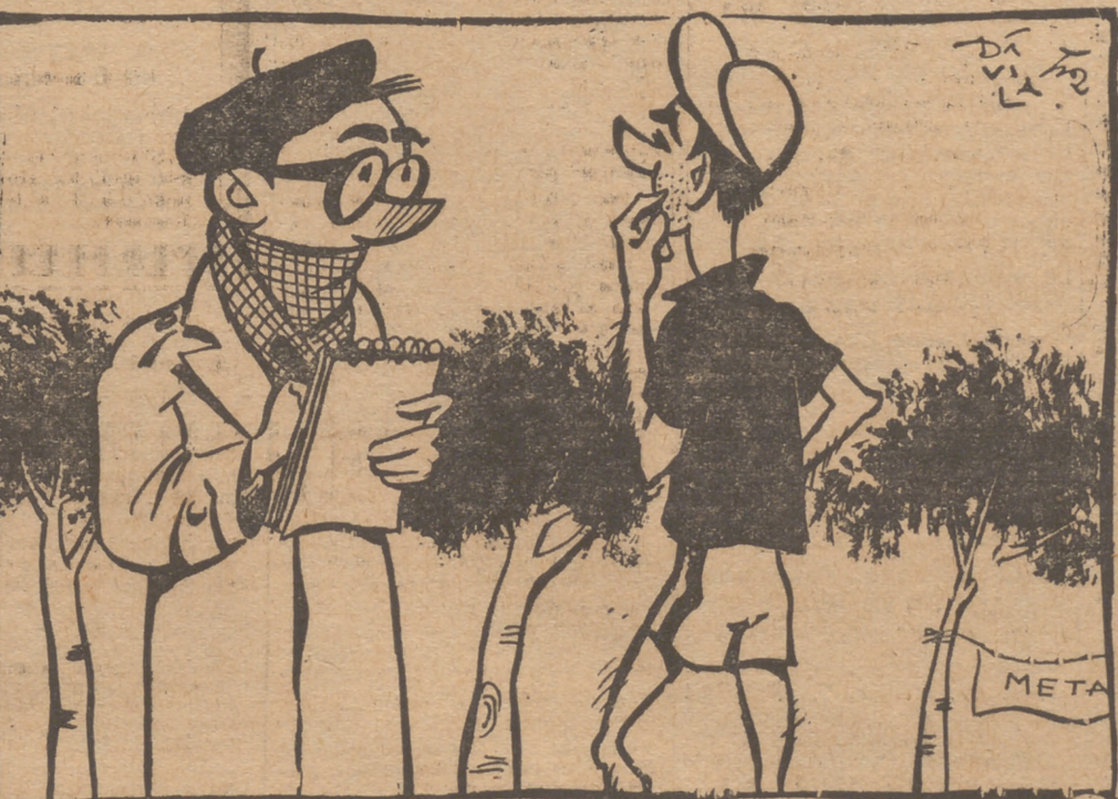
—Y después de la etapa de Zamora ¿cuál consideras la más difícil. —La etapa de Escartin...

FABRICA DE GABARDINAS Confeccionadas a medida. Precios y calidades sin competencia. GALVEZ. Infantas, 5. Teléfono 22 04 72