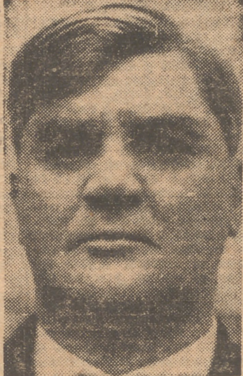
Unions, en Margate, donde se votó por gran mayoría en favor del programa británico de rearme.

Para Bevan, el rearme viene a interrumpir el progreso social y a paralizar la evolución de los países económicamente retrasados, por los que siente una gran preocupación. Opa, pues, por las catástrofes graduadas en vez de los castigos y por la mantequilla en lugar de los cañones. Esta actitud clara ante el rearme fué derrotada completamente, como se recordará, en la Conferencia de las Trade