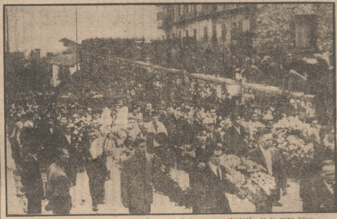
El entierro de los seis obreros que perecieron sepultados en la catástrofe de la mina "Sociedad de Santa Lucía, atraviesa las calles de la localidad leonesa. El fúnebre acto fue presidido por las autoridades provinciales, y a él se sumó el vecindario en pleno.