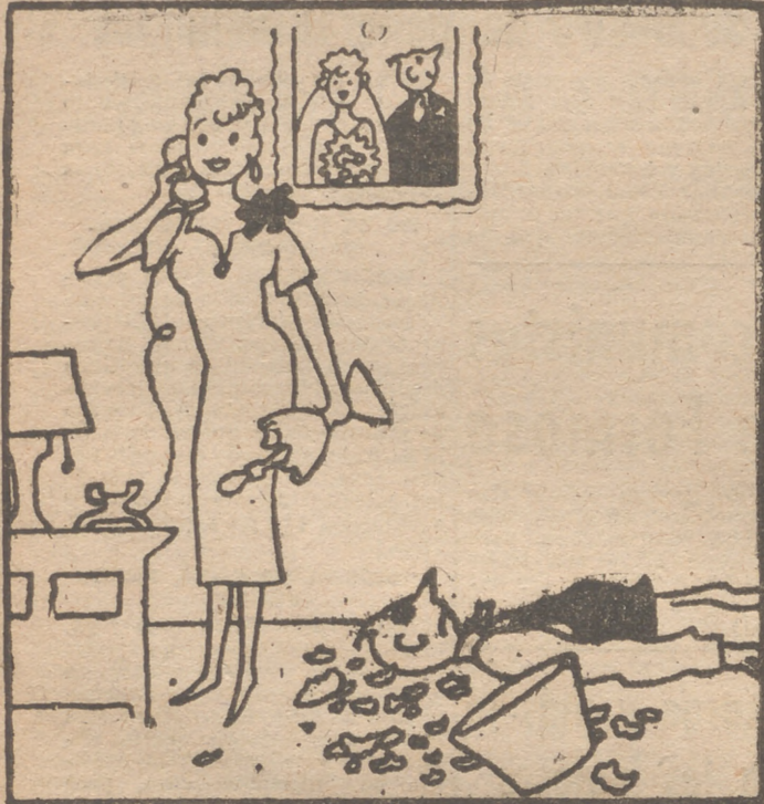
—¿Y ahora qué tengo que hacer, mamá?