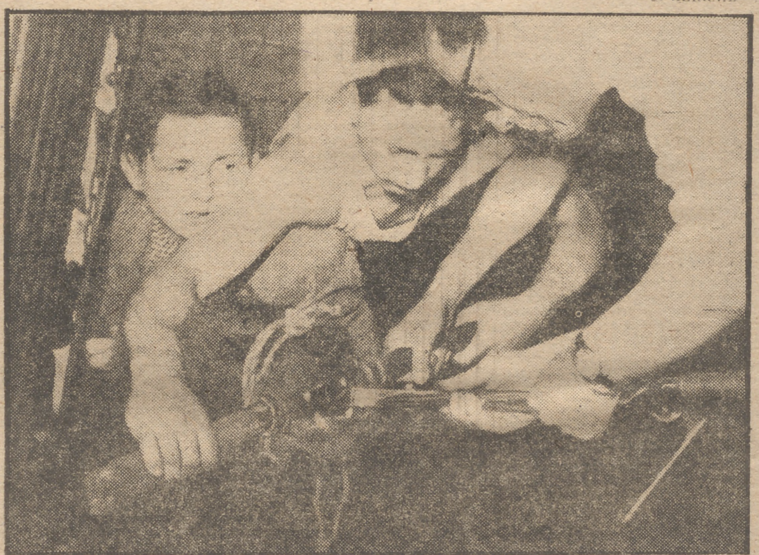
He aquí el momento culminante de la operación a que fue sometido hoy el "adolescente" y mal-humorado oso "Charlie". Como puede apreciarse en la fotografía, la cosa no resultó nada fácil. A pesar de que el plantigrado hallábase ya bajo los efectos de la anestesia, hubo que recurrir a diversas y espectaculares tretas: un palo firmemente introducido entre las mandíbulas, fuertes ataduras y varios hombres en jaque. ¡Y todo ello para que "Charlie" no muerda a nadie cuando trabaja horas extraordinarias!

—¿Ha hecho usted alguna "fotografía" a "Charlie"?— —No. Yo creo que su mal humor nace de que cuando sale a trabajar a la pista le pongo bozal y todavía conserva el recuerdo de una herida que le causó el mismo. —¿Volverá a trabajar con el oso?— —En Madrid, no. Hay que dejarlo que se calme y tornemos a ser amigos. Uno de los colmillos que le han serrado le voy a engarzar en oro para regalárselo a mi madre el día de su cumpleaños. —Cuando salimos del local circense venos a un simio que con cara muy triste pasea en brazos de su dueño. Se llama "Chaplin" y se halla con un ataque de gripe. La osa "Jenny", causante de nuestro susto, se entretiene por su parte en arrojar al suelo el agua cuantas veces le llenan su recipiente. ¡Es una juguetona! C. HERRAIZ