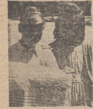
¿Qué propone usted para amenizar los periódicos?

9 ¿Por qué razón cuando los madrileños se ausentan de la Villa se creen superiores a los demás que co-dean? (Luis Cebrián, Camellos, 19, Aranjuez.)