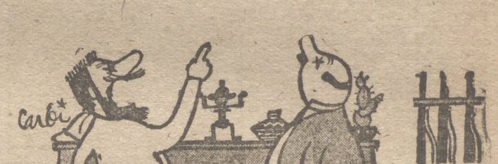
—Esa cabeza me costó una lucha terrible. Una vieja amiga se empeñó en dejármela como herencia; yo resistí con furor épico, y... ¡hela ahí!