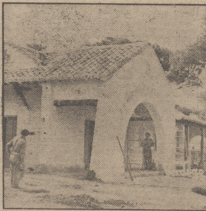
Uno de los pabellones que figuran en la Feria Nacional del Campo, inaugurada esta mañana.

tal derrotaron más allá de nuestras fronteras a quienes pretendieron rendir por hambre a los defensores de este bastión hispánico. Sus pabellones en la Feria Nacional del Campo son tiendas de campaña que guardan trofeos victoriosos ganados bajo la Capitanía de Franco para la Patria.