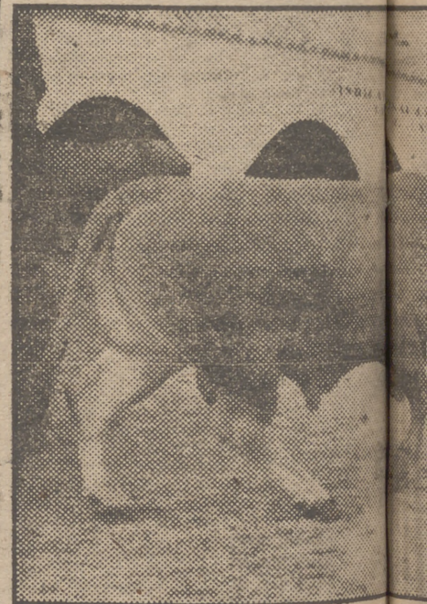
Más de 4.500 cabezas de ganado se exhiben... males que más llaman la atención.