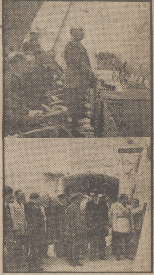
El Jefe del Estado pronunciando su magnífico discurso en el salón de honor, durante el acto inaugural de la I FERIA Nacional del Campo, celebrado solemnemente en la mañana de hoy. En la fotografía de abajo se ve a Su Excelencia el Generalísimo ante uno de los pabellones de las Cámaras Sindicales Agrarias de provincias.