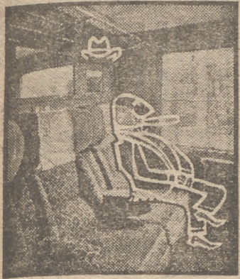
Así se va en primera.