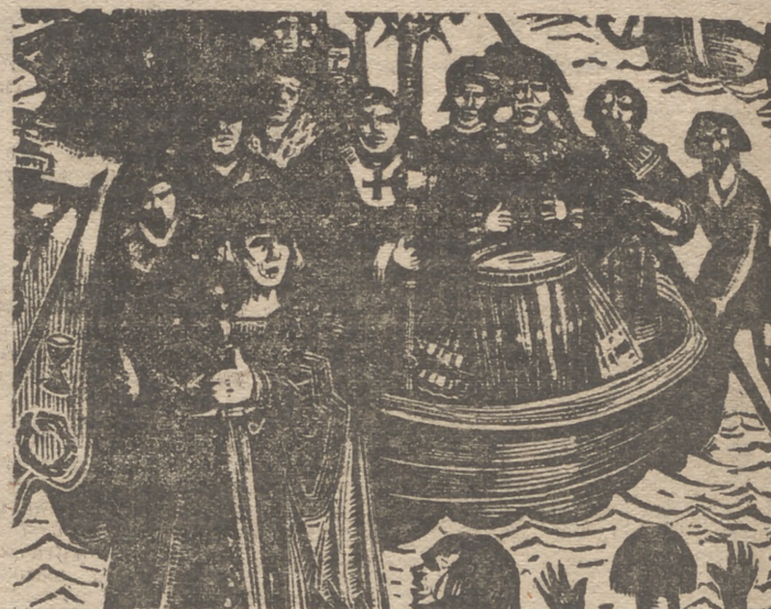
Si Colón no hubiese descubierto América, otro lo hubiera hecho.