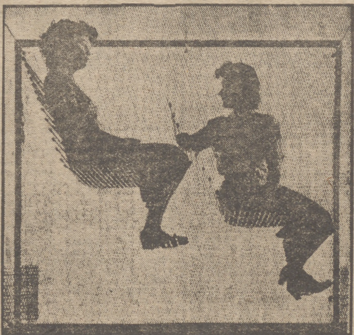
Bocetos de asientos para autobuses de dos pisos.

Y cuando se visita un viejo castillo, amueblado según lo que entendemos que era el estilo de la época, sorprende la falta del sentido de la comodidad en nuestros antepasados. La antigüedad usaba y abusaba del banco de piedra. El estilo imperio no empleaba más que líneas verticales. El estilo Luis XIV es nobilitario por excelencia y exige una actitud rectilínea. El Luis XV explica que muchos pintores de la época hayan colocado sus escenas en lechos. La silla de la Edad Media indica una vida ruda. Y el asiento de los aviones actuales es bueno para mujeres sin corsé y para hombres de mullida espalda.