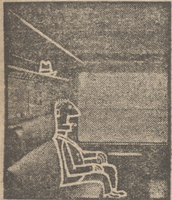
Así se va en tercera.