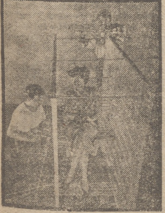
Un aparato especial para graduar un asiento.

CAMELO A los pocos días de haber entrado en la guerra la Unión Suráfrica, un miembro de la oposición se levantó en el Parlamento, y a sabiendas de que era punto menos que imposible darle respuesta exacta, le preguntó al general Smuts cuánto le había costado el rearme al país. El general le dijo que le daría la respuesta al día siguiente. En efecto, apenas abierta la sesión, levantóse el general Smuts, sacóse para soltar la voz, y dijo: —La cifra de gastos que se me pidió ayer desde esos escaños—y señaló los de la oposición—asciende a 80.169.000 libras, 10 chelines y 6 peniques. Tras breve silencio, la Cámara estalló en aplausos. Terminada la sesión, un amigo del general le preguntó cómo se las había arreglado para llegar a conocer la cifra con tal exactitud. —Ni la conocía—contestó Smuts—ni la conozco. Lo único que sé es que la oposición me sacará dos meses y veinte días para averiguarla y demostrar que estoy equivocado.