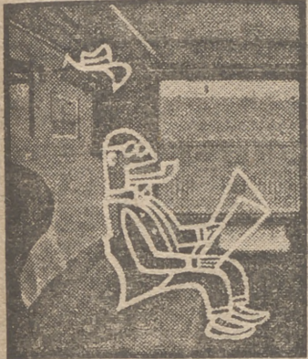
Así se va en segunda.