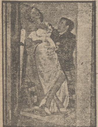
He aquí la silla especial para "estrellas".