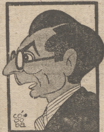
Anoche fué estrenada en el María Guerrero la comedia original de Víctor Riuz Iriarte denominada "El landó de seis caballos", que alcanzó un gran éxito.

Esta obra, más que una comedia, me parece un bello y dulce poema en donde se mezcla la gracia y la sonrisa y en donde la nostalgia queda envuelta por el velo de la fantasía.