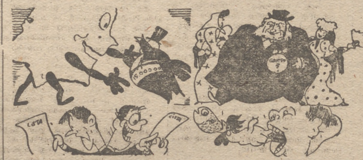
La lotería es un vicio inocente y un aliciente en la vida.