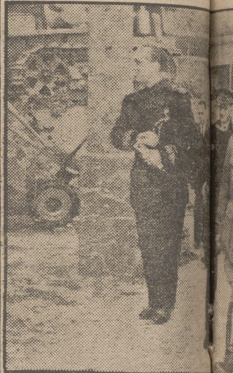
El Jefe del Estado, acompañado de los señores... Feria Nacional del Campo.

Sería ingenuo que, por lo expuesto en los respectivos «stands», creyéramos que en este particular nos encontramos en primera línea. Mas no cabe duda de que para la inmensa mayoría constituirán una aleccionadora sorpresa los resultados realmente positivos y totalmente satisfactorios alcanzados en determinados aspectos. Un hecho, además del valor de tales resultados, quedará patente: que el grosero y malintencionado tópico de la incapacidad del español para la invención y el trabajo técnico es uno de tantos casos ya vistos para sentencia condenatoria.