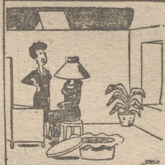
—Creo que con este modelo te he causado molestia.