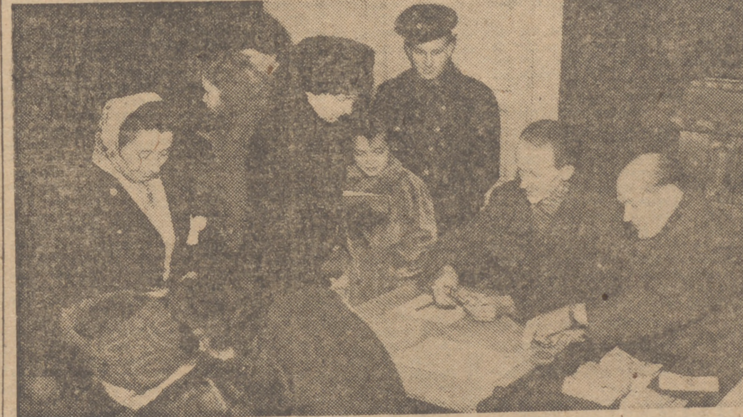
Los habitantes de la zona occidental de Berlín cambian sus marcos émpresos en el sector soviético por marcos occidentales. También han sido canjeadas las cartillas de racionamiento.