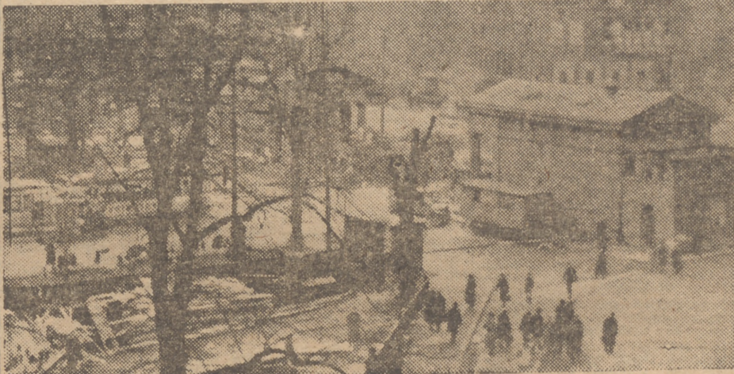
Al derrumbamiento material de Berlín durante el último capítulo de la contienda ha sucedido el desmantelamiento moral en el epílogo de la postguerra. Pero nada hay perenne.