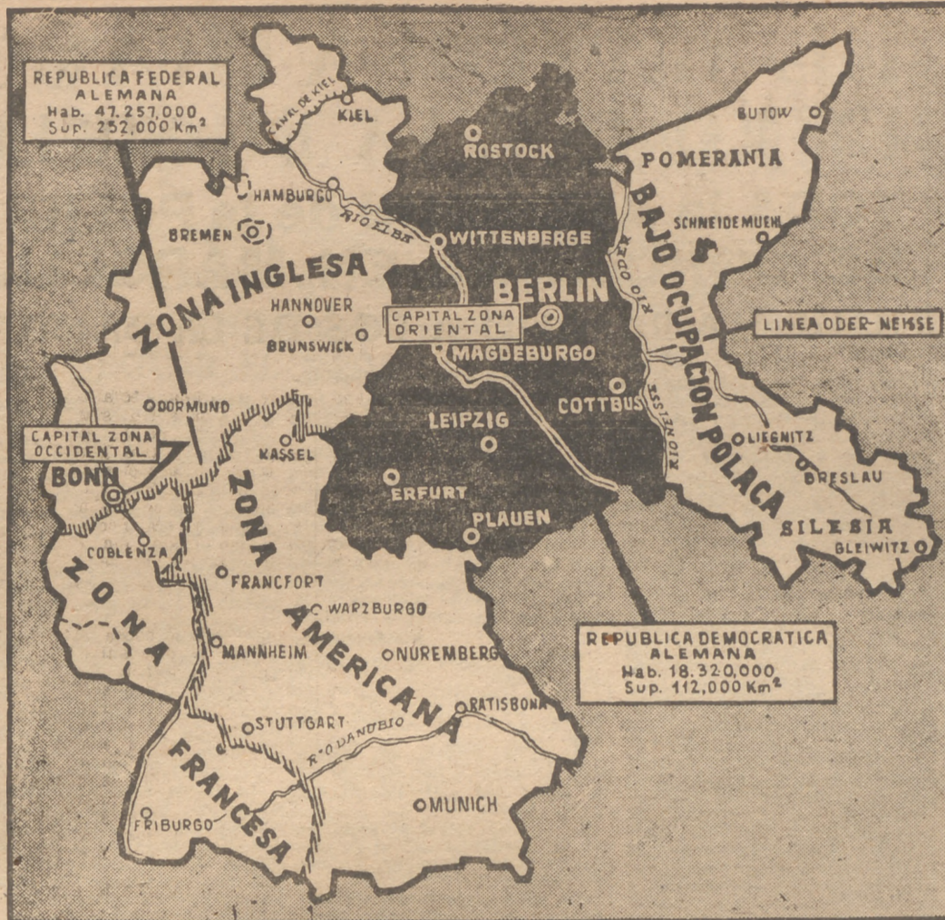
He aquí a la actual Alemania. Es la antigua, dividida en tres partes: la de ocupación polaca (Pomerania y Silesia) de ricas minas de carbón; la República Oriental Alemana (territorios ocupados por los Soviets) y la República Federal Alemana (zonas ocupadas por los occidentales). El lector puede sacar de este gráfico interesantes consecuencias.