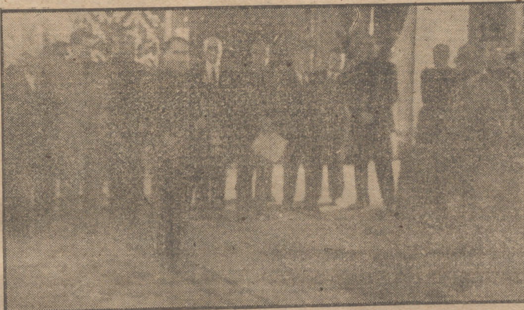
El Caudillo recibe a los comisionados de la Asamblea Nacional de Hermandades Sindicadas en el Palacio de Oriente.