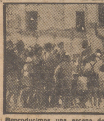
Reproducimos una escena de "Un americano en vacaciones", divertido film cuyo estreno tendrá efecto el lunes próximo, en el cine Imperial, presentado por Confisa.