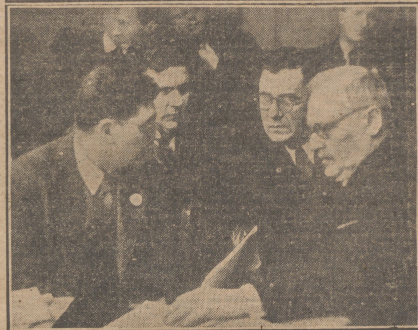
Dos apartes de los delegados de Inglaterra, Mr. Bevin, y de Estados Unidos, Stettinius (arriba), y de Wichinsky con Gromyko y otros (abajo). Estas fotografías, obtenidas durante los agitados debates de la O. N. U. en torno a la presencia de las tropas británicas en Grecia, recogen dos escenas interesantes del "match" Bevin-Wichinsky, del que salió tan malparado el delegado soviético. En la foto superior, Bevin y Stettinius cambian impresiones; en la de abajo, Wichinsky y sus segundos comentan los duros golpes de la cartera dialéctica de Mr. Bevin.