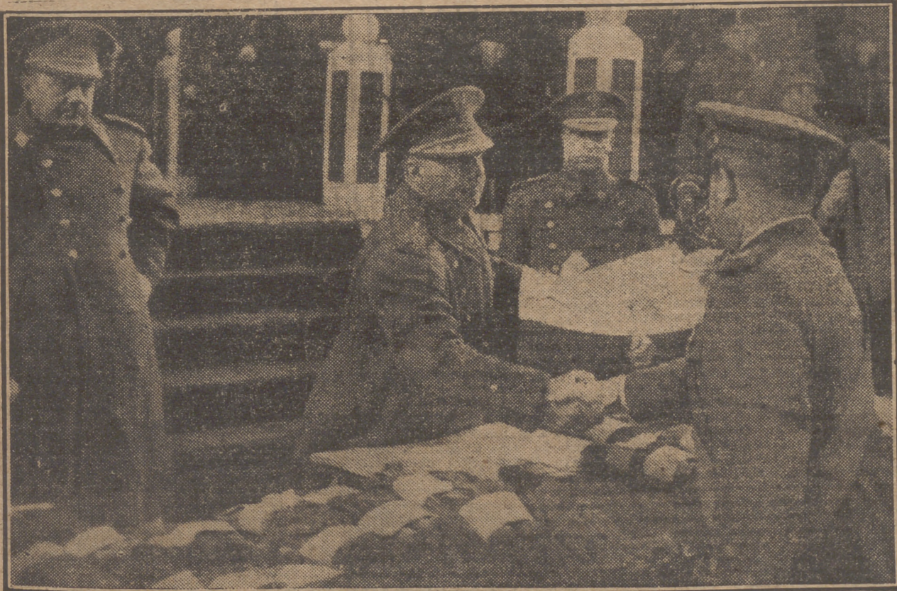
Su Excelencia el Jefe del Estado hace entrega de los diplomas a los nuevos oficiales de Estado Mayor.

¡Arriba España! ¡Viva España! (Una clamorosa salva de aplausos que duran largo rato acoge las últimas palabras del Caudillo.)