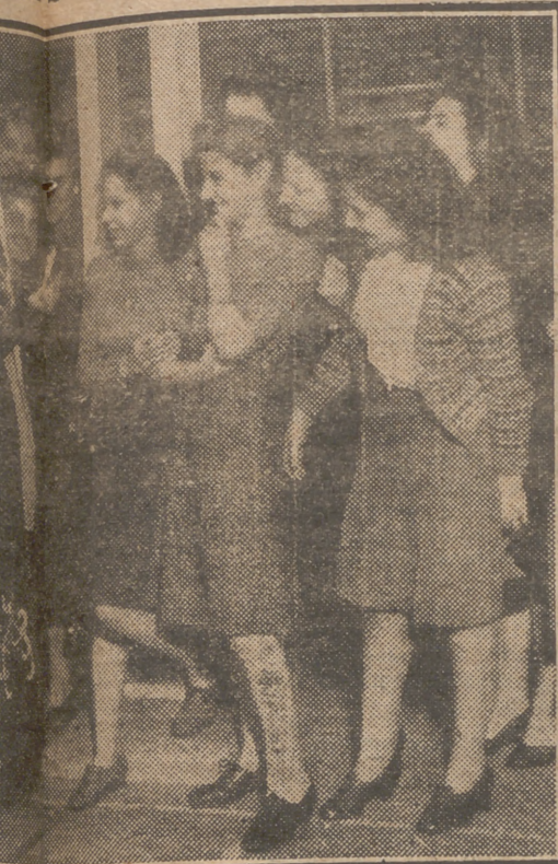
Se trata de resucitar las costumbres históricas de distintas épocas de la vida americana que las señoras de su compañía de trabajo durante las tareas de una exposición de las modas del Oeste.