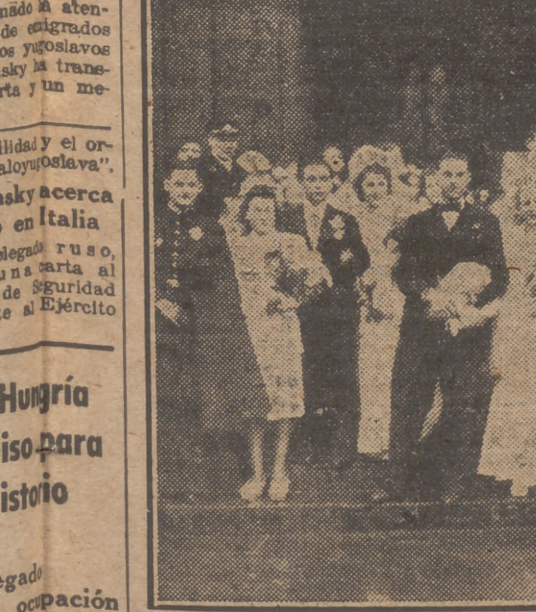
En la iglesia de Saint Denis, de París, se ha celebrado la boda tradicional denominada "esponsales de las seis vírgenes". Todo el distrito acude con flores con las que obsequia a las felices nuevas esposas. "¡Vivan los novios!", clama la multitud. "¡Vivan los doce novios!", dice un profesor de Matemáticas. "¡Seis lunas de miel!", suspira una chica romántica. "¡Buen negocio!", piensa un vendedor de cunas y ropitas para niños. "¡Vaya un ejército!", susurra un escéptico pensando en las doce suegras. "¡Los tontos no acaban!", comenta un solterón empedernido. "¡De dónde han salido tantos hombres?", pregunta una casadera incansable. "¡Dios les dé salud, cartillas y cebollas!", musita una pobre mujer que regresa de la compra.