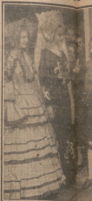
En las fábricas modernas se trata confeccionando trajes de distintas épocas, modelos exhiben ante sus preparatorias de una gran exposición