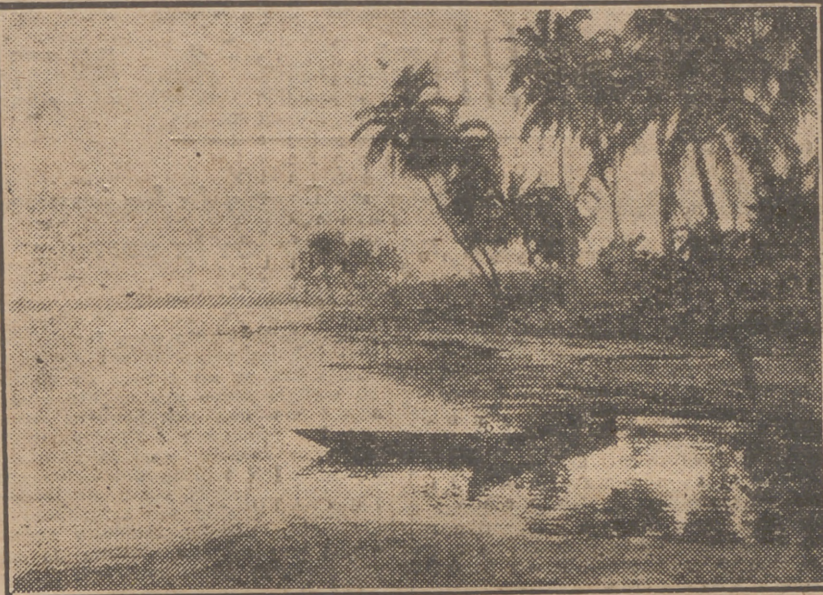
"Playas de Punta Europa" (Fernando Poo), de Núñez Losada.