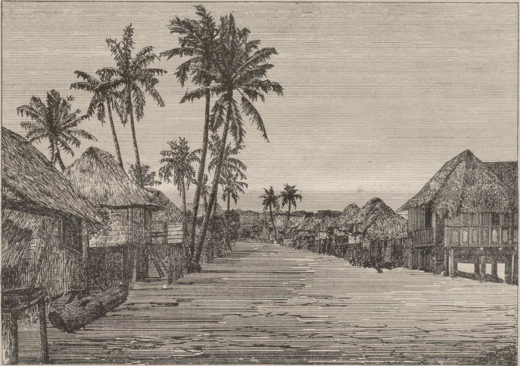
VISTA DE LA CARRETERA DE LEGASPI Á ALBAY.

Con meditacion profunda, suministrada por