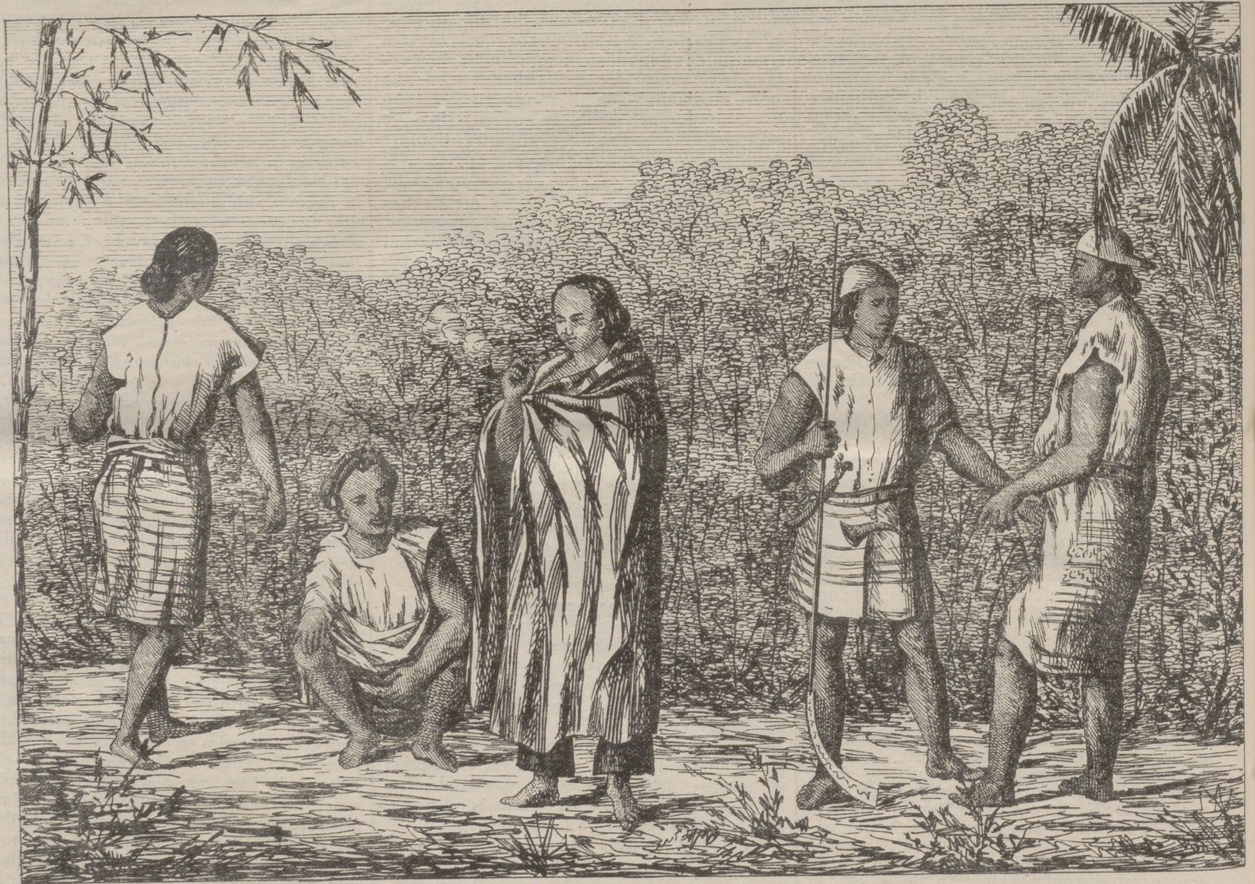
TIPOS DE LA ISLA FORMOSA.

ciones, había estudios previos ejecutados muy de antemano, y que por tanto ellas podían acometerse sin vacilación y con la seguridad de un éxito positivo en todos sentidos, mayormente cuando ya iniciado el proyecto de reformas en la materia, en virtud de las disposiciones del Supremo Decreto de 29 de Diciembre de 1868, y en parte planteadas por el Superior ya citado, de 29 de abril de 1869, esperábase las mismas en su planteamiento efectivo, sin sobresalto ni dudas, antes bien, repetimos, con la seguridad de que producirían para todos resultados muy beneficiosos y apreciables.