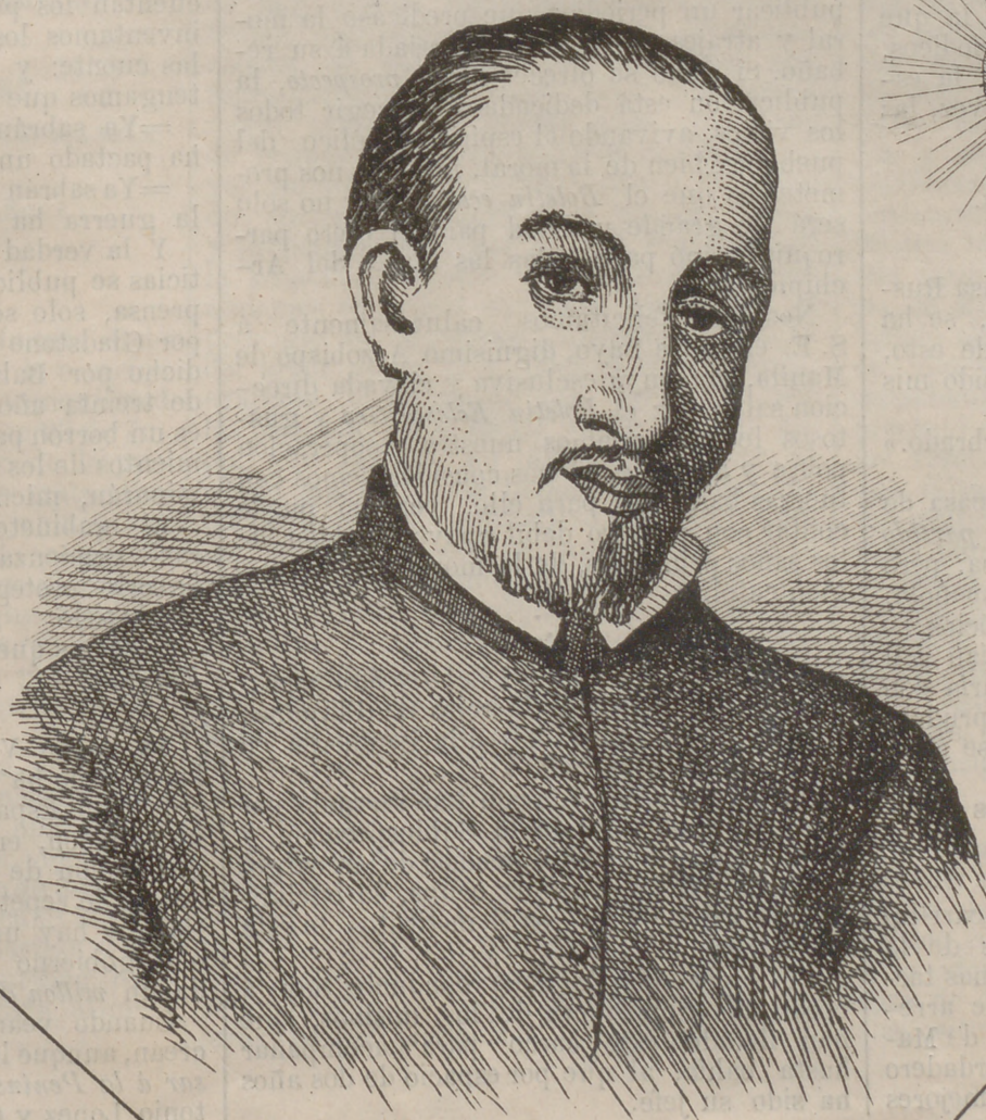
EL VENERABLE PADRE DIEGO LUIS DE SANVITORES.

juguete que no hemos tenido el honor de examinar, pero que hemos adivinado en las manos de un simpático cargador chino. Y como el hombre es tan frágil y tan propenso á incurrir en el pecado, claro es que el juguetito á que aludimos, alcanzará gran boga entre nosotros, ó entre algunos, siendo un nuevo motivo para que la benevolencia ó la justicia permanezcan tranquilas en su casa. En cuanto á los trampolines, no soy yo quien los ha visto, sino los que en vez de concurrir á la fiesta de Porta-Vaga, en Cavite, concurren al próximo pueblo de Polo, ya pasando por el camino de Malabon, ya por el que conduce desde Tonsuya á Tinajeros. Así el puente de Meypajo como el otro, de cuyo nombre no queremos acordarnos, están ladeaditos, flojitos, podriditos, desniveladitos, en fin... en todas las condiciones necesarias para pasarlos sin otro temor que el de caer. Salvo esto y el correspondiente baño de agua y lodo: salva la inmediata sumer-