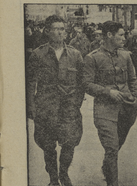
Así tratan los milicianos a los soldados que luchan a la fuerza en las filas fascistas y que caen prisioneros de los nuestros. En Barcelona —una vez comprobados los antecedentes de cada uno— tienen plena libertad, están entre los suyos...

Y las firmas dicen todas —cosa curiosa y singular—: «por el Gobierno»