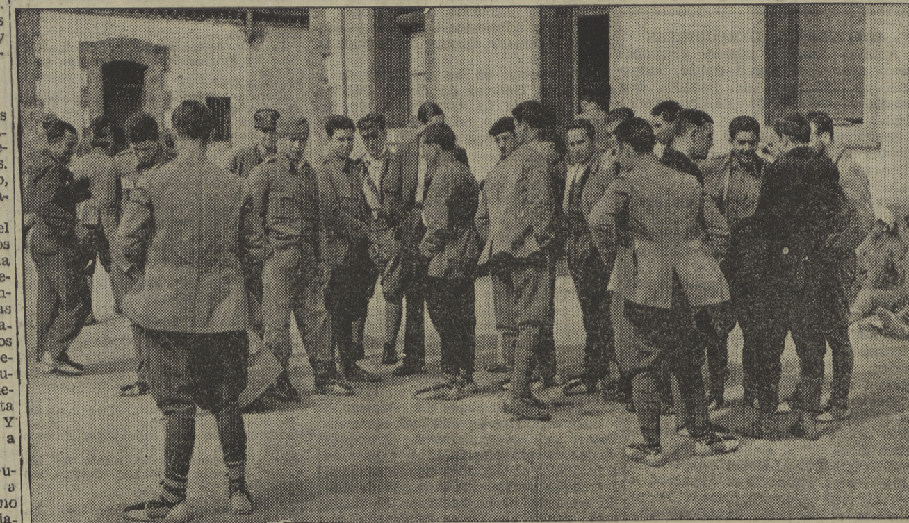
En el patio del cuartel, los soldados gallegos hechos prisioneros por nuestros milicianos en el frente de Aragón, charlan y explican detalles de la situación en territorio fascista. Les parece imposible poder hablar con paisanos.