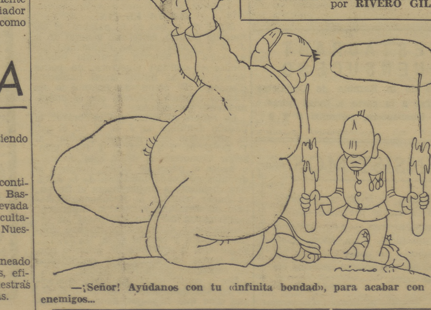
—Señor! Ayúdanos con tu infinita bondad, para acabar con nuestros enemigos—