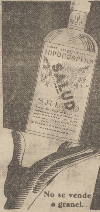
No se vende a granel.

“Con motivo de la instalación en Madrid de los servicios de este Ministerio, los señores ministro, subsecretario y directores generales, no recibirán visitas ni audiencias de ninguna clase durante toda la semana del 9 al 15 del presente mes. Los directores generales de Minas, Comunicaciones Marítimas, Pesca e Industrias, comenzarán el despacho de los asuntos el lunes día 9 y el de Comercio el miércoles 11.”