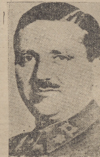
GENERAL BAUTISTA SANCHEZ, Jefe del 9.º Cuerpo de Ejército

denes inmediatas del ministro del Ejército, los generales Llanderas y Alonso Vega. Ha sido aprobado un de-