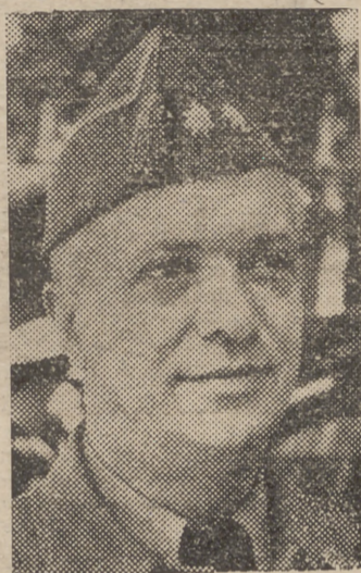
EL CORONEL D. VALENTÍN GALARZA, NUEVO SUBSECRETARIO DE LA PRESIDENCIA

(Más información en las páginas centrales)