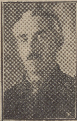
GENERAL BARRÓN, Subsecretario del Ministerio de Marina

nistración Central, el actual Gobernador civil de Zaragoza, don Antonio Iturmendi.