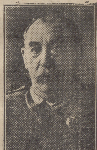
TENIENTE GENERAL SALIQUET, Jefe de la 1.ª Región Militar