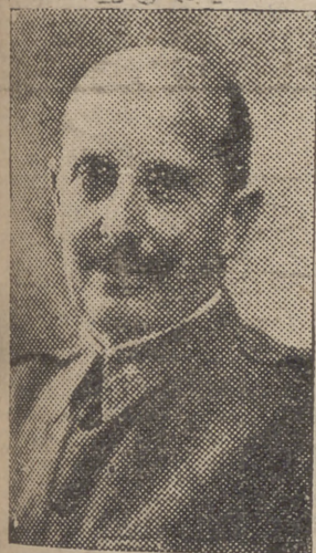
TENIENTE GENERAL DAVILA Jefe de la 2.ª Región Militar

BURGOS, 16.—Esta tarde se reunió el Gobierno en Consejo, bajo la presidencia del Jefe del Estado. En la Dirección general de Prensa, de orden del ministro de la Gobernación, se facilitó a los periodistas la siguiente referencia de lo tratado en el Consejo.