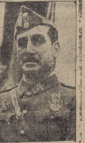
GENERAL GARCIA VALINO, Jefe del 10.º Cuerpo de Ejército

Han sido aprobados, finalmente, expedientes de crédito y de movimiento de fondos."