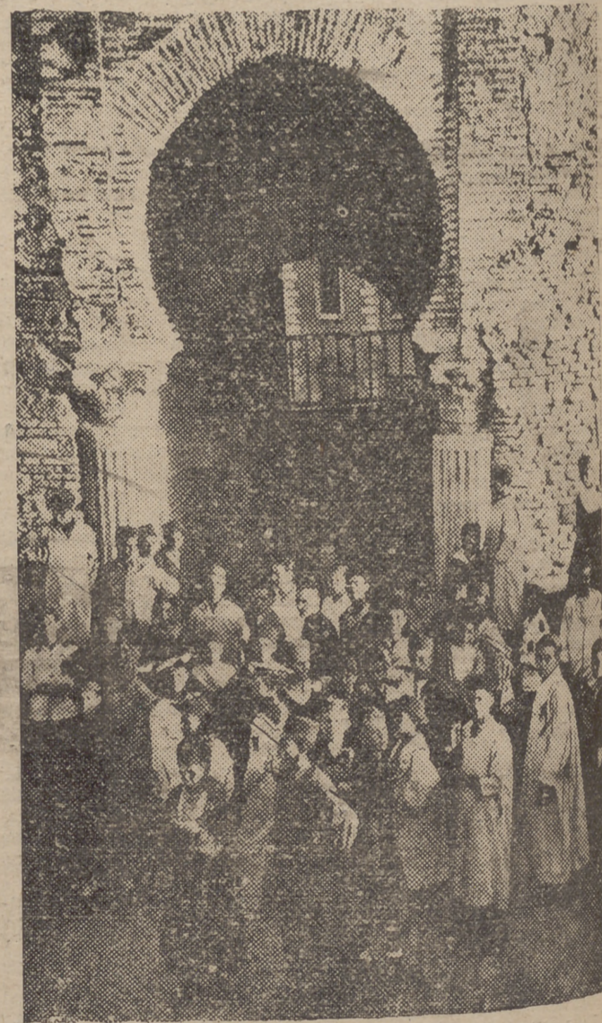
Grupo de niños marroquíes, que ayer llegaron a Málaga, en su visita a la Alcazaba