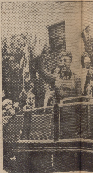
S. E. al salir del Palacio Municipal en ocasión de la multitud, que movió el espectáculo

Al llegar al puente de Torremolín, en el que formaban la primera las fuerzas de Aviación,