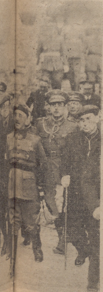
de las autoridades locales, recorrió la de restaurarse parte del histórico monumento árabe

El espectáculo ofrecido no tiene precedentes en la historia de Málaga. En la cara del CAUDILLO reflejábese la satis- facción que le proporcionaba el espectáculo grandioso que a sus ojos se ofrecía.