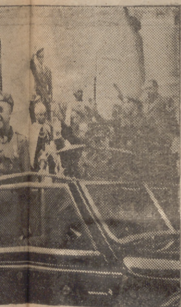
que más corresponde a las aclama- que no cesó de vitorearle en todo el trayecto

con escuadra, bandera y música rindieron honores al CAUDI- LLO. En la Alameda, que lleva el nombre del GENERALISIMO y hallábase alfombrada con una bandera roja y gualdá floca con serrín, también fué grandísimo el entusiasmo pero éste llegó al máximo en la calle de La- los.