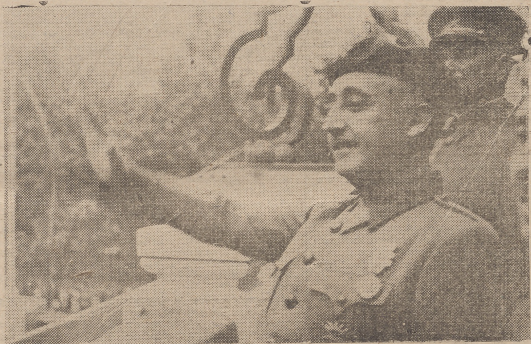
Desde el balcón del Ayuntamiento, el GENERALISIMO saluda al pueblo malagueño, que le aclama frenéticamente

El GENERALISIMO recibió, en la hermosa finca "Las Palmeras", apenas reposo, realizó sus visitas a la Alcazaba, a la Catedral entusiasmo delirante de la multitud.-FRANCO, las auto