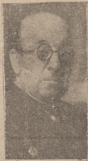
El heroico general Moscardó. Representa a España en las fiestas que celebra Alemania en honor del 50 cumpleaños de Adolfo Hitler

Explican los diarios el significado de esta amistad de Italia y Hungría con Yugoslavia, expresando la certeza de que se examinarán los problemas de la Europa central en las conversaciones que han de celebrarse.