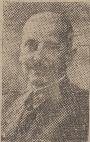
El ministro de Defensa, general don Fidel Dávila

dad con banderas nacionales en las manos, saludaron al CAUDILLO, que correspondió sencillamente.