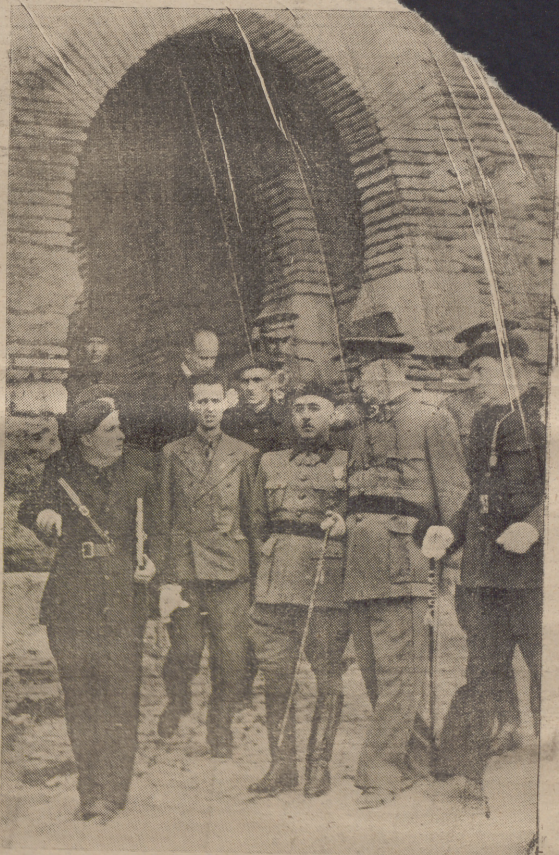
EL CAUDILLO, con el general Quejido de Llano y autoridades malagueñas, en la visita que giró a la Alcazaba, para conocer las obras de restauración de la histórica fortaleza

Cerca de las dos de la tarde el CAUDILLO llegó a su resi- dencia, donde le fueron rindi- dos honores por una compañía