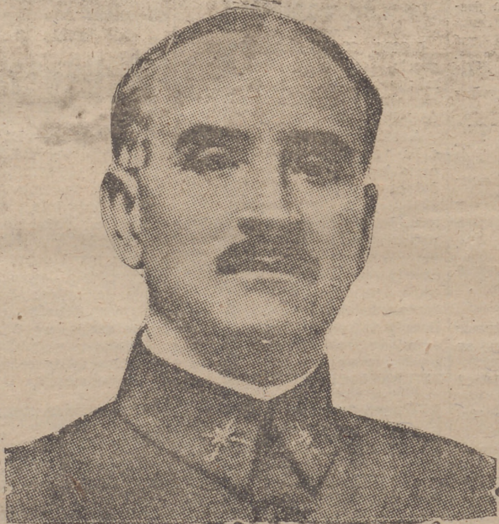
El general jefe del Ejército del Sur, don Gonzalo Queipo de Llano