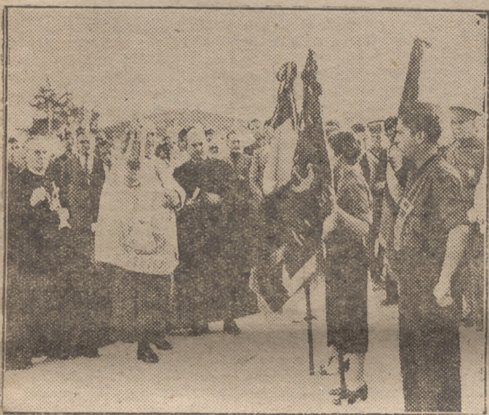
El Sr. Obispo de la Diócesis en el momento de bendecir las banderas entregadas ayer a los Flechas Navales