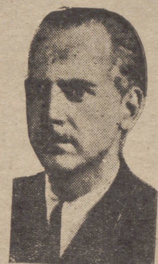
El ministro del Interior, Sr. Serrano Súñer