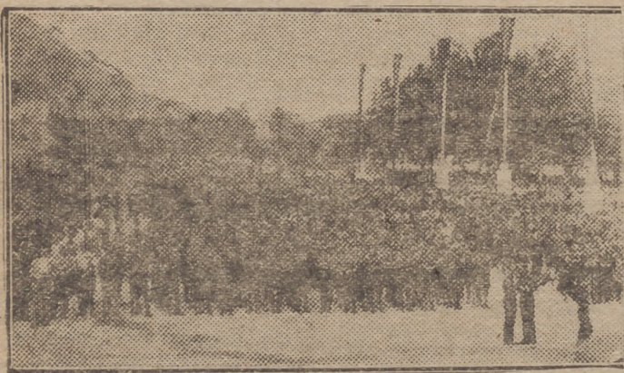
Grandioso aspecto del Parque durante la concentración celebrada en la tarde de ayer