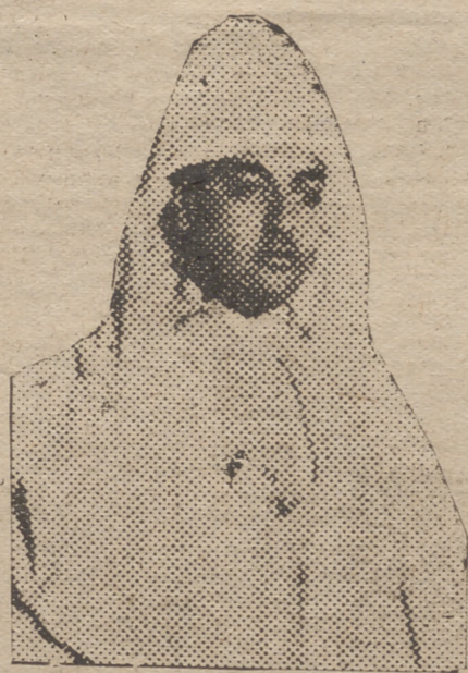
S. A. R. EL JALIFA

actos, las campanas de la Catedral y de todas las iglesias de la ciudad, hicieron un repique general, señalando así la entrada en el III Año Triunfal. Por primera vez, desde antes que se proclamara la indigna república, han sonado a gloria las campanas de nuestras iglesias. Desde entonces han permanecido mudas o han tocado aisladas. Así, pues,