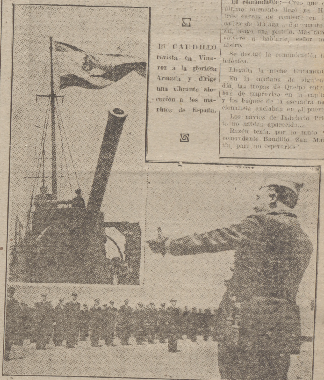
El CAUDILLO revista en Vinaroz a la gloriosa Armada y dirige una vibrante alusión a los marinos de España.