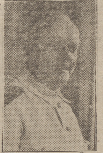
El almirante Cervera, jefe de la Escuadra nacional

En este día, solemne por la festividad de la Virgen del Carmen y por la conmemoración de los Caidos de nuestra Armada, nos parece oportuno reproducir el vibrante y magnífico discurso que el GENERALISIMO dirigió el 31 de mayo, desde las playas de Vinaroz, a las gloriosas dotaciones de los buques de guerra nacionales. He aquí las elocuentes palabras del CAUDILLO: "Marineros de guerra, ¡Marineros de España! Sois el último de una familia quebrantada por el dolor, que con el heroísmo de sus otros hijos, con el heroísmo de sus marineros, se ha salvado. Vosotros sois los guerreros del mar y seréis mañana los maestros y conductores de las nuevas naves. Los marineros del Imperio hay que decir Marina y cuando la Marina desaparece, cuando los buques no surcan los mares, cuando la bandera de España no pasea por el mundo, ya no hay Imperio y ya no hay Estado. Vosotros sois el último hijo y por consiguiente el hijo que se cuida con mimo, el hijo que se puede lanzar al azar porque en él está todo el honor de la Marina, todo el honor de un pueblo. La consigna para los jefes, es hacerse querer y respetar, porque si esto hubiera pasado siempre, si hubiera habido cariño constante y tenido más Marina."