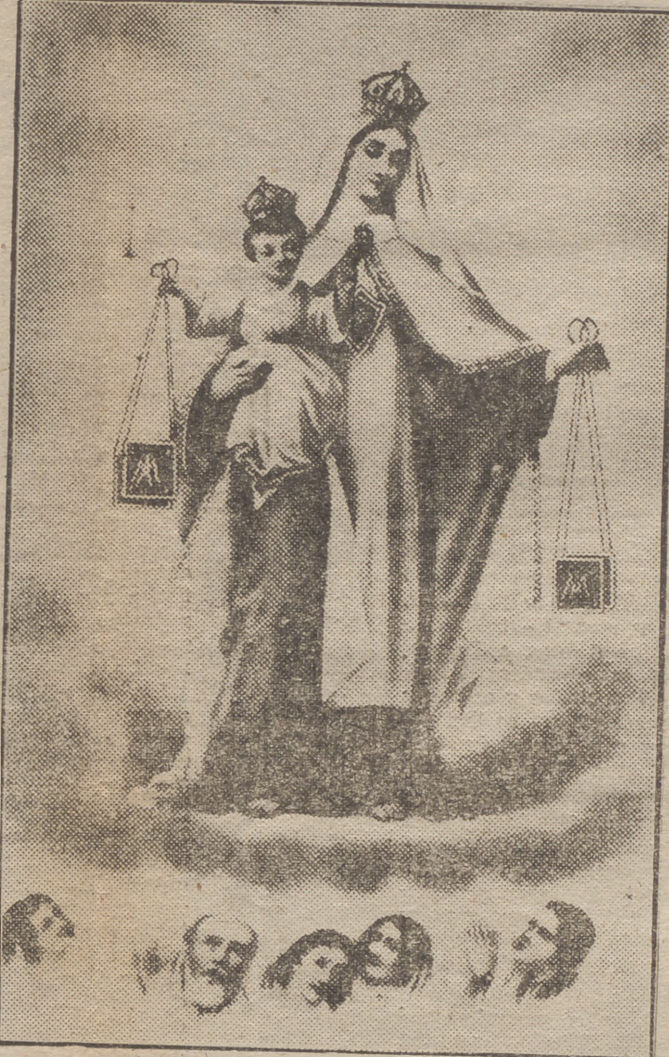
DEL CAUDILLO A LOS HEROES DEL MAR