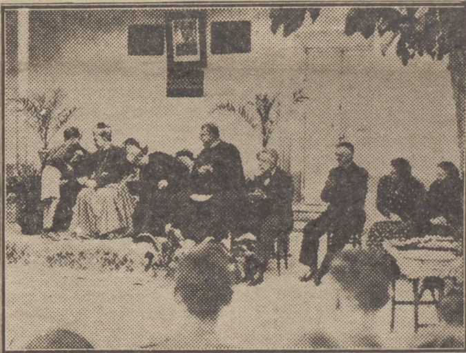
Un momento del solemne acto de clausura del Curso Catequístico celebrado el domingo en las Escuelas Salesianas, bajo la presidencia del Excmo. Sr. Obispo y Junta Diocesana de Acción Católica