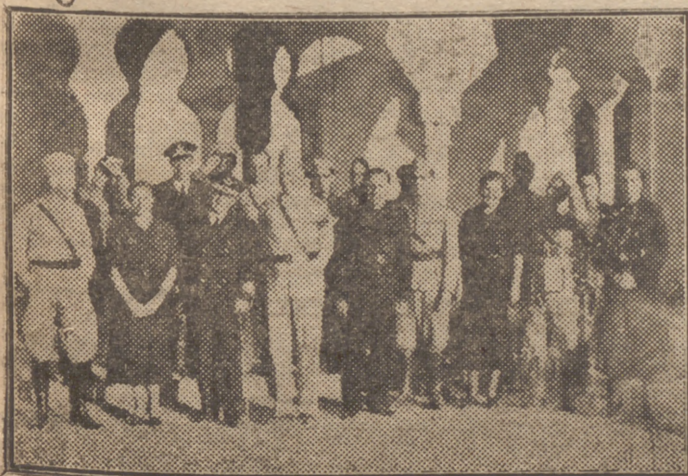
La Comisión de la Escuela Superior de Guerra, durante su visita a la Alcazaba