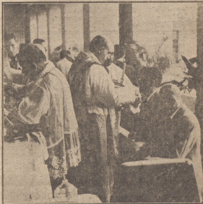
El Excmo. Sr. Obispo administrando la Sagrada Comunión en la Cárcel