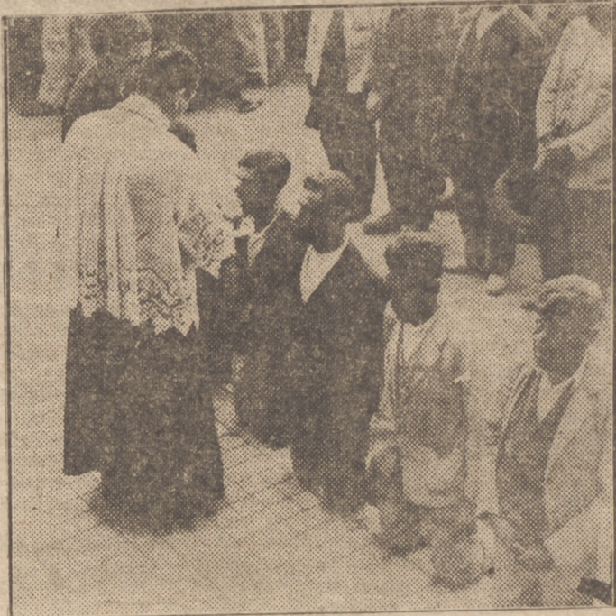
Otro momento del Cumplimiento Pascual en la Prisión

LONDRES, 24.—Se asegura que la 43 división roja, que se encuentra bloqueada en la zona pirenaica, está a punto de pasar la frontera, pues su situación es insostenible.