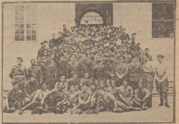
Los requetés de la Reserva del Tercio de N. S. de la Victoria, de F. E. T. y de las J. O. N. S., celebraron la Comunión Pascual, el domingo pasado en la Catedral. La "foto" representa a éstos, presididos por el Jefe local de Milicias, Jefe de Reserva, y oficiales del servicio de armas.