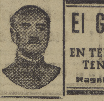
LO DE TERUEL

"MADAME X" Aviso a su distinguida clientela que puede servir FAJAS Granada, 27 - Málaga