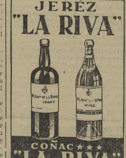
JEREZ "LA RIVA" COGNAC

Burgos, 9 de noviembre de 1937. Firmado, Francisco Franco Bahamonde.