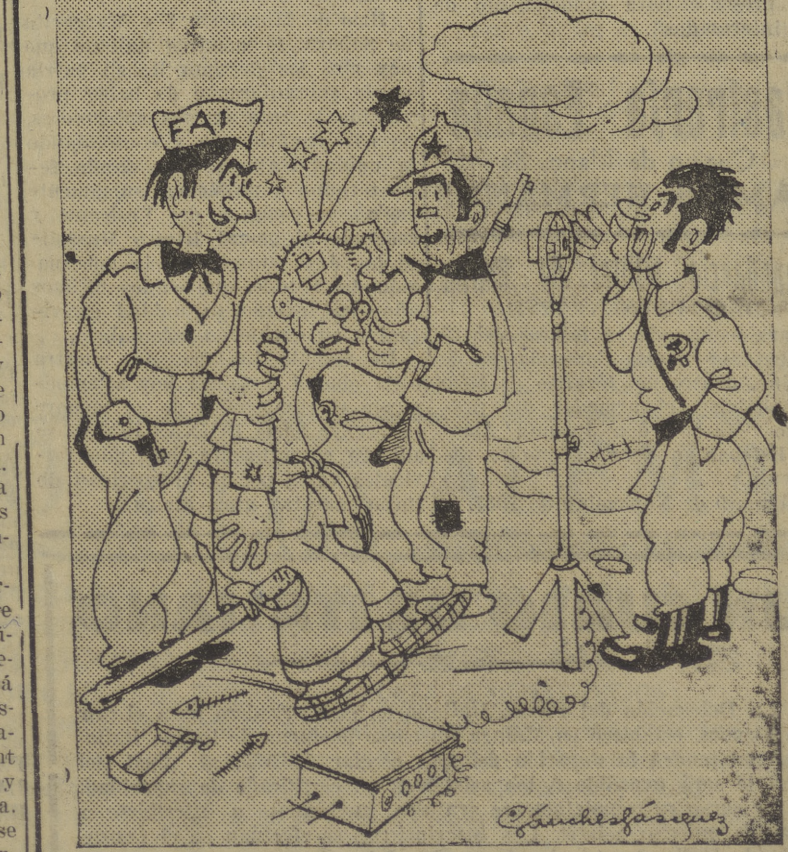
—Y ahora, queridos camaradas os va a hablar el «glorioso» defensor de Madrid, que vuelve optimista y victorioso del frente...