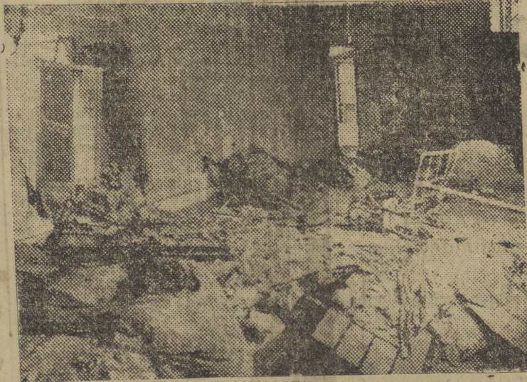
MOTRIL.—Una de las salas del Hospital de Santa Ana, donde cayó y explotó una de las bombas arrojadas por los aviones rojos el 17 de Junio de 1937, haciendo muchos muertos entre los enfermos que allí se encontraban.

BRUSELAS, 6.—Han llegado a esta ciudad numerosos evacuados de Bilbao, entre los que figuran niños y personas mayores.