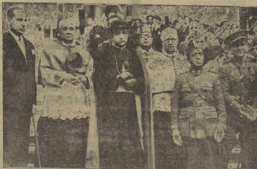
El Prelado acompañado de las autoridades que fueron a recibirle.