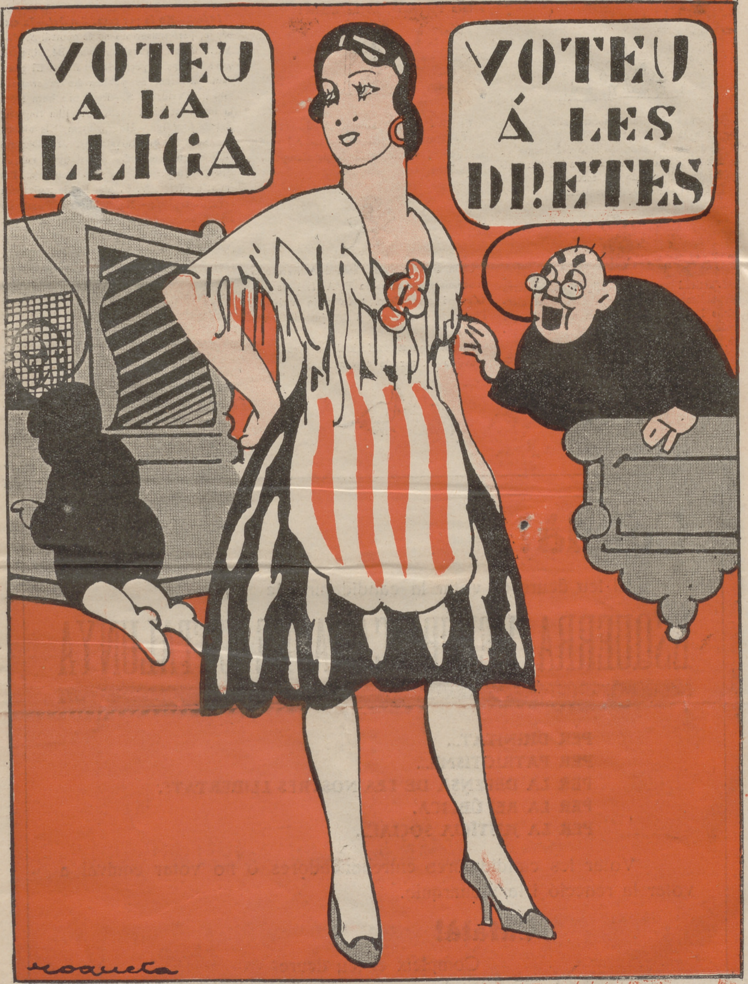
-Pobra gent! Ja no s'entenen!