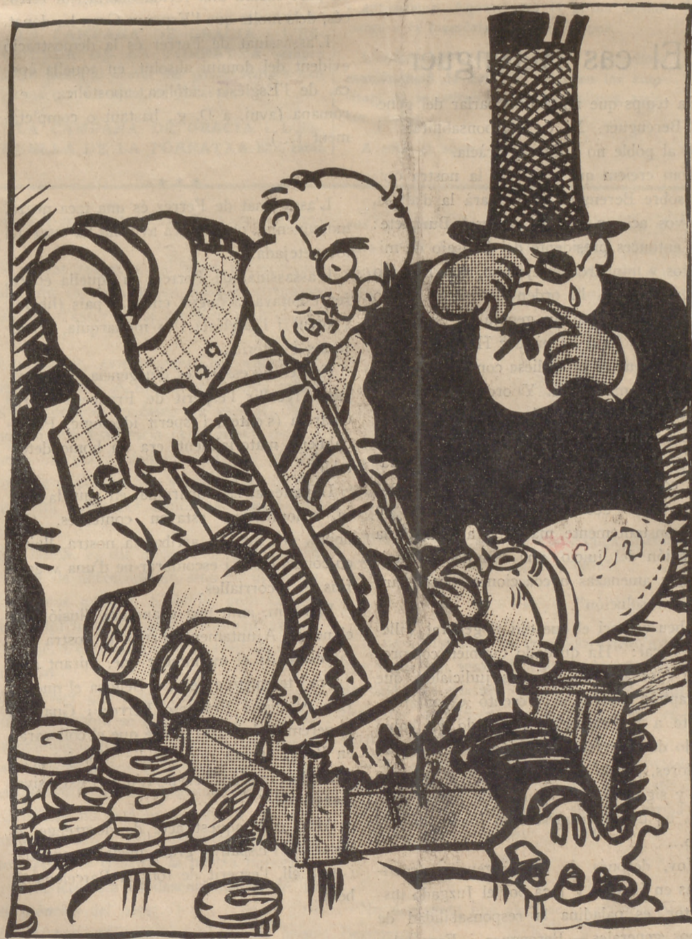
El bon cirurgià

Després la Lliga girà els ulls a Madrid; quan parlava del Borbó, s'enternia; quan parlava de l'ex-palau reial, li queia la bava; quan veia Cambó i Ventosa i Calvell disfressats de ministre, encara li queia més; quan sentia l'ex-marxa reial — tots els punts de la Lliga la tenien a casa en discos—, plorava d'emoció patriòtica.