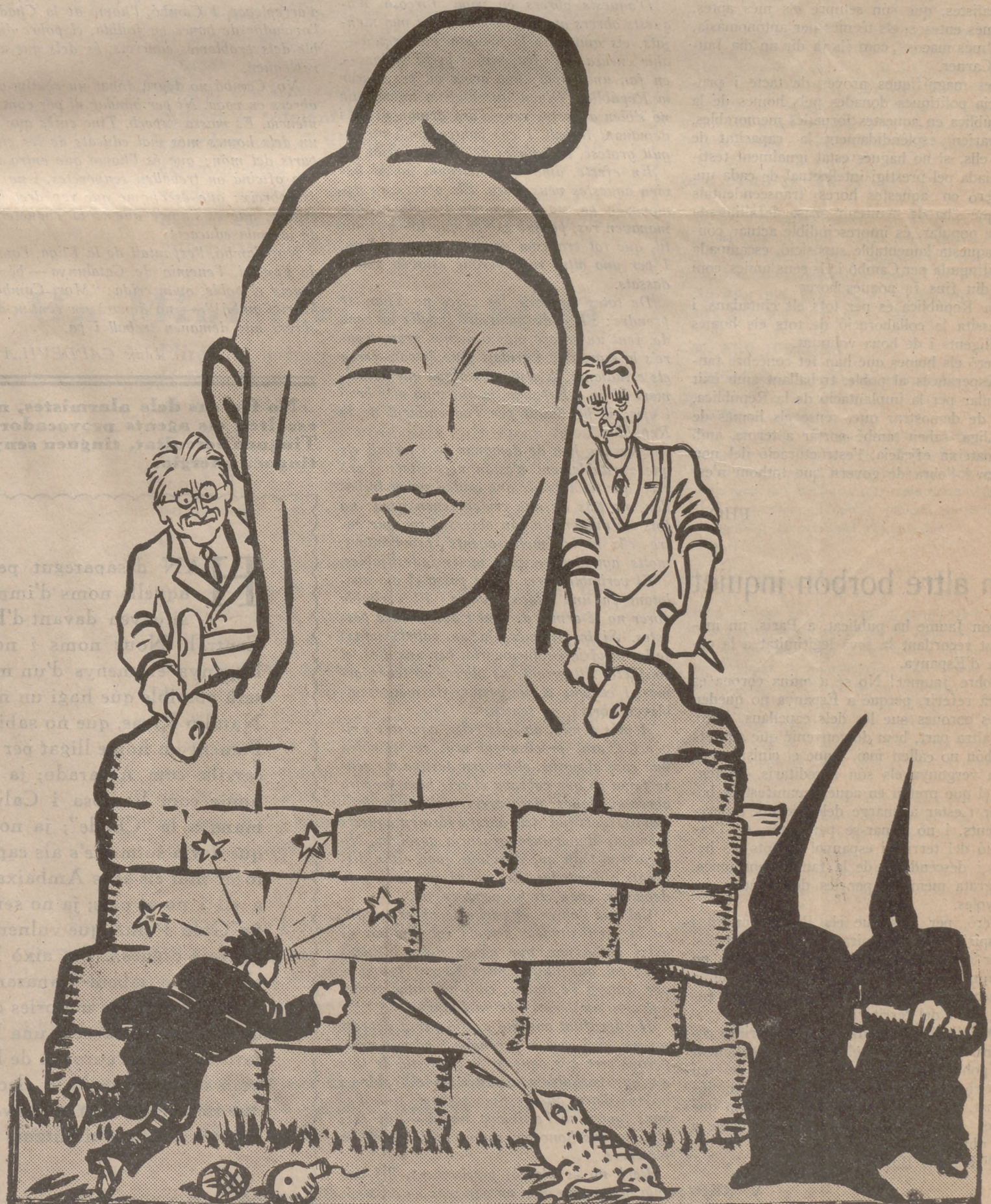
La República somriu

Es que la Lliga, sota la seva exterior indiferència per la forma de govern, amagava l'adhesió que sempre han tingut les nostres classes adinerades pels règims tradicionals, i