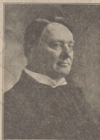
Lord Northcliffe, periodista anglès, creador i propietari de grans diaris, mort recentment

Quan els dies d'angoixa de Verdun, mentre