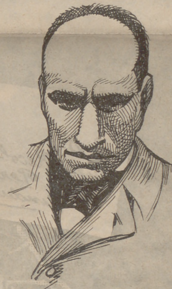
Mussolini, capítol dels fascistes italians

En aquest món la qüestió està en saber si fer les coses ben grosses, que estiguin bé o malament