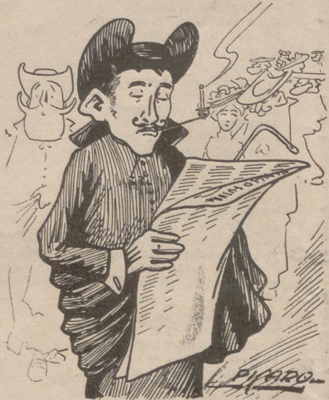
Un vicari de la primera volada.