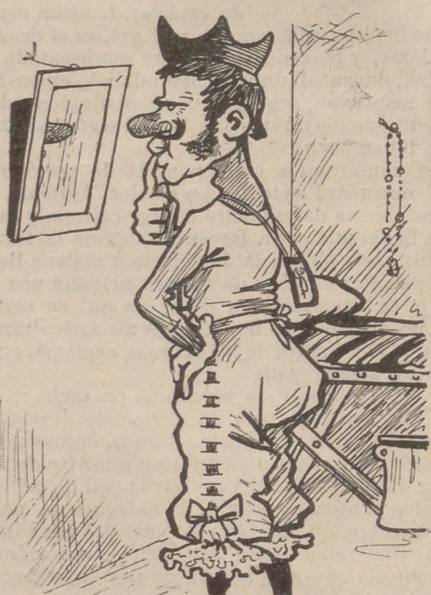
—Trobo que ab el bigoti no hi van bé las faldillas: hauré de posarme pantalóns.