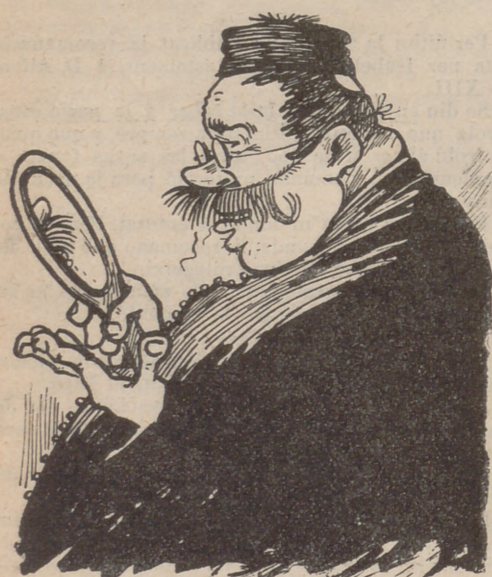
—Jo no tinc paciència: interinament me creix el natural, me 'n poso un de postís