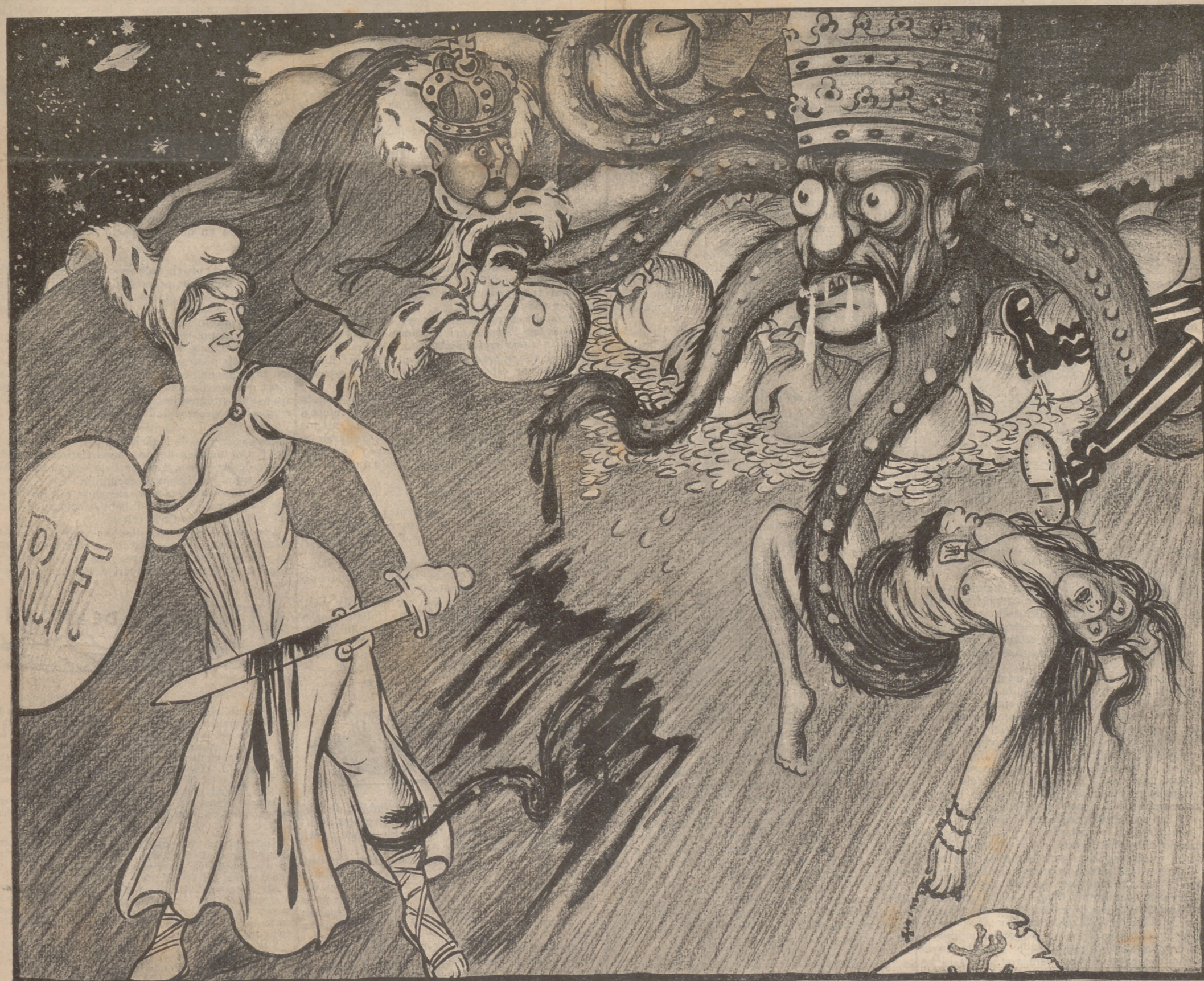
—Vés explotant á n' els altres, que á mí no 'm xuclarás més.