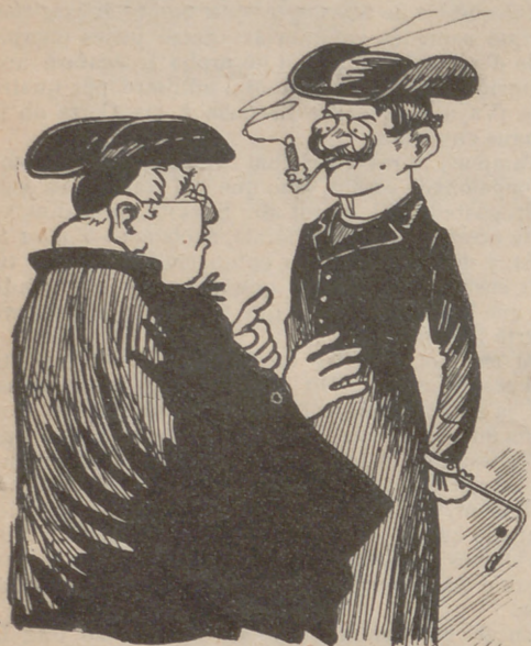
—¿Sab que aquest bigoti 'm resulta massa modernista? —¡Fugil... Vosté en tot hi troba pels.

El Papa ha autorisat als capellans per deixar-se pel a la cara.