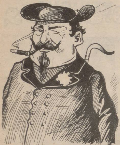
Capellá de carrabiners.