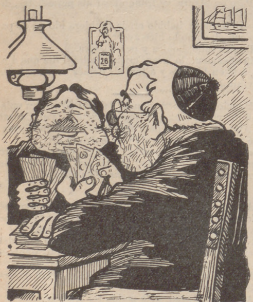
—Noya, ara sí qu' en questió de pel a la cara, ja casi estém tants a tants.