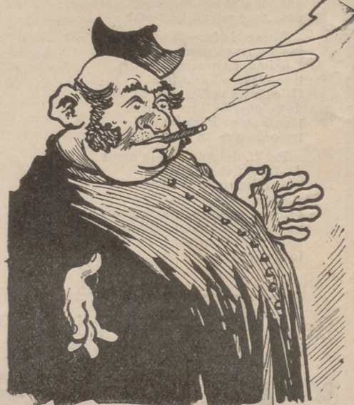
—¡Vaja! Que vingui l' Agujetas ara; que vingui el Badila...