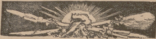
D. GASPAR NÚÑEZ DE ARCE.