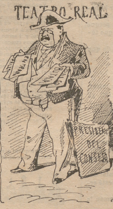
Entrada... á mans besadas.