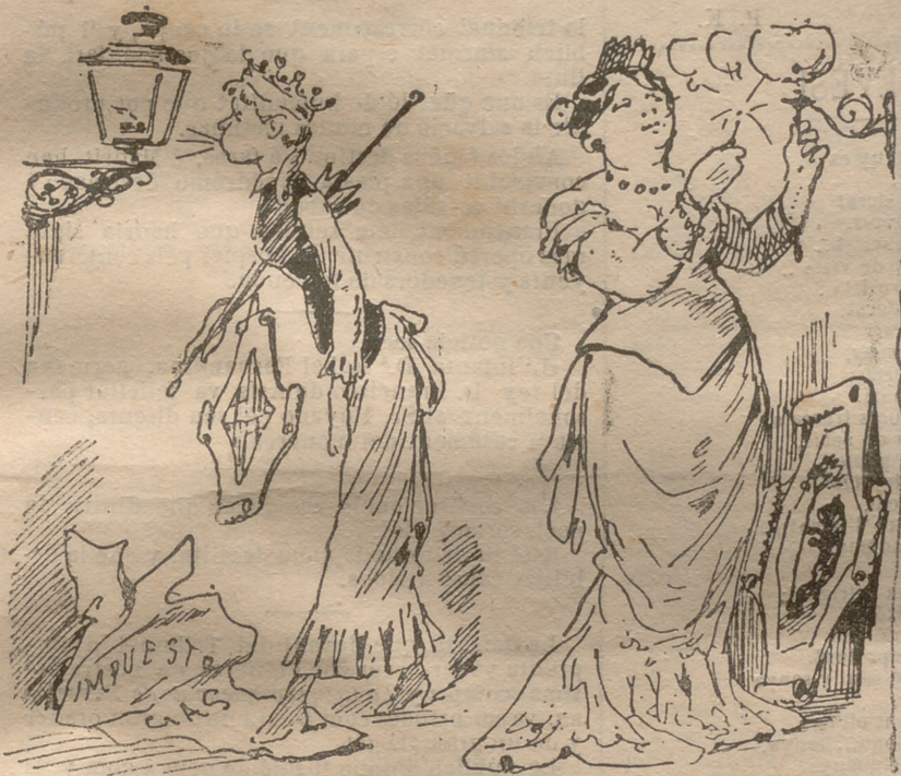
Mientras Barcelona apaga, Madrid il-lumina.