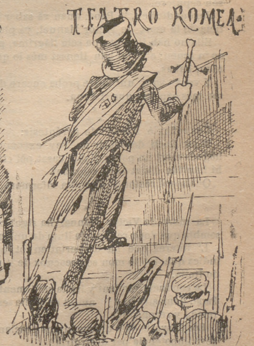
—Entrada gratis y ab esquellots.