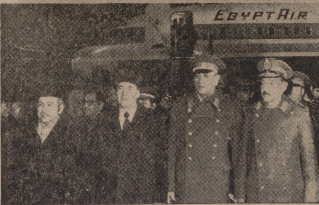
MOSCU.—El Ministro egipcio de Asuntos Exteriores, Ismail Fahmy (izquierda), y el Ministro del Ejército de la República Árabe de Egipto, Gany Gamsy (derecha), a su llegada al aeropuerto de Moscú, donde fueron recibidos por el Ministro soviético de Asuntos Exteriores, Andrei Gromyko, y el de Defensa, A. Grechko (segundo por la derecha).