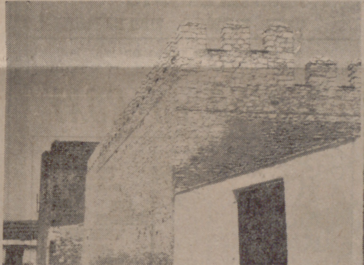
Detalle del castillo de Bolaños, alineado con otras construcciones rurales.

Bien, Todos sabemos que la región manchega: Albacete, Ciudad Real, Cuenca y Toledo, no es sólo tipismo, con o sin el «Quijote». Ni todo es vino, ni todo es queso, ni todo es llano, ni todo es monte. La Mancha es diferente como España, y ofrece verdaderos alardes de monumentalidad. Por ejemplo, castillos. Castillos que están bien conservados, y mal conservados; aplicados unos a dedicaciones propias de su jerarquía: el sueño de siglos y la muerte lenta, y otros invertidos—que están o estuvieron—en extraños menesteres, como aquel que fue cementerio, aquel que fue palomar, aquel que es santuario, aquel que fue plaza de toros. (Aparte de que hay uno que viene siendo todavía, porque desde 1900 está preparado para ello, caso taurino «ad hoc», que es el de Mortara, en Piedrahuesa).