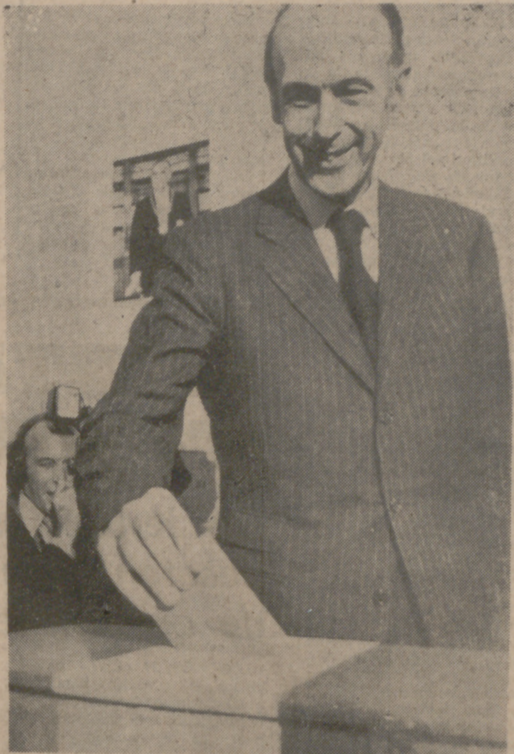
FARIS.—Giscard d'Estaing, en el momento de depositar su voto, en el colegio electoral instalado en el Ayuntamiento de la localidad de Chanonay, cerca de Clermont Ferrand.

Seguidamente, el grupo de gente que por medidas de seguridad y espacio debió quedarse fuera del edificio, en un trazo de calle corta. (Pasa a la siguiente)